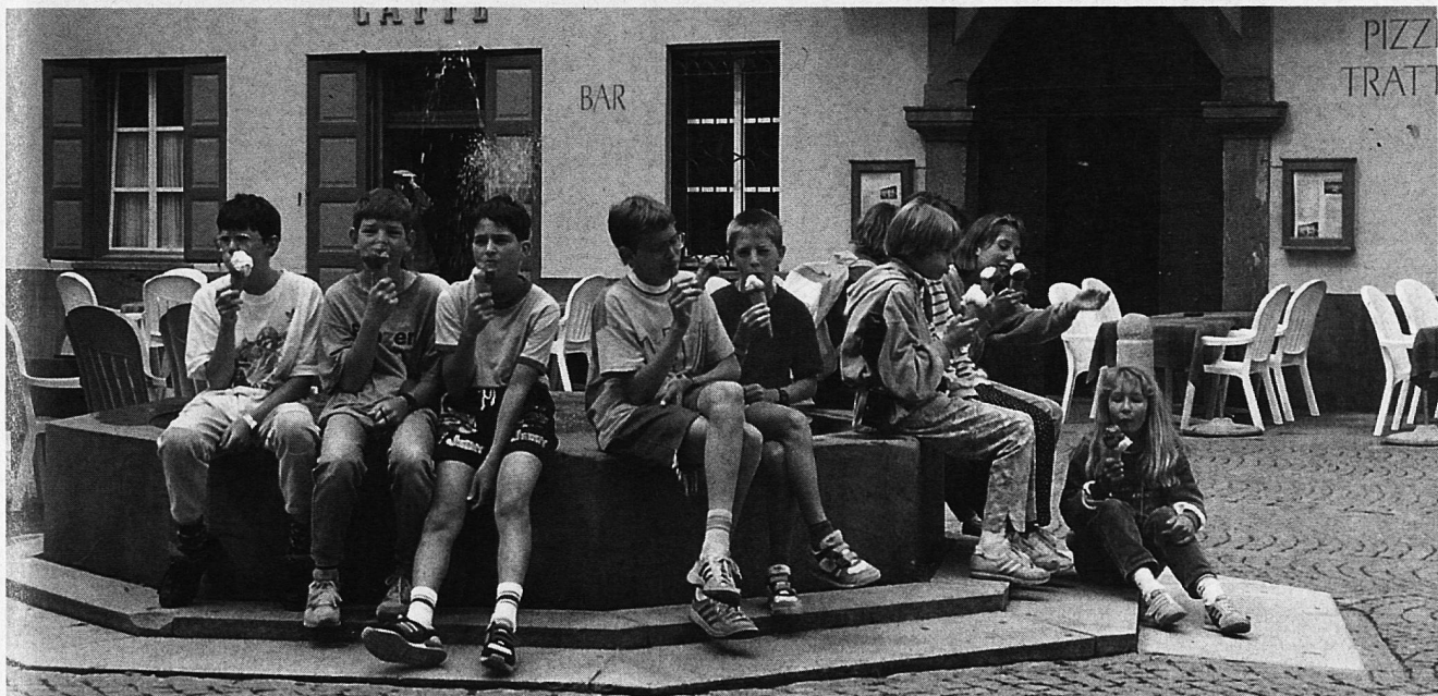
Eisgekühlt an die nächste Aufgabenstellung...

Klären Sie ab, ob Ihre Schulgemeinde für Lager und Lagerunfälle versichert ist. Wenn dem nicht so ist, bietet Pro Juventute eine spezielle kollektive Unfall- und/oder Haftpflichtversicherung für Lager an. Für eine Woche liegen die Kosten für die kombinierte Unfall- und Haftpflichtversicherung bei Fr. 4.30 pro Person für Sommerveranstaltungen und Fr. 22.30 für Winterveranstaltungen. Anmeldung und Information: Pro Juventute, Fachdepartement Versicherungen, Postfach, 8022 Zürich, Tel. 01/251 72 44.