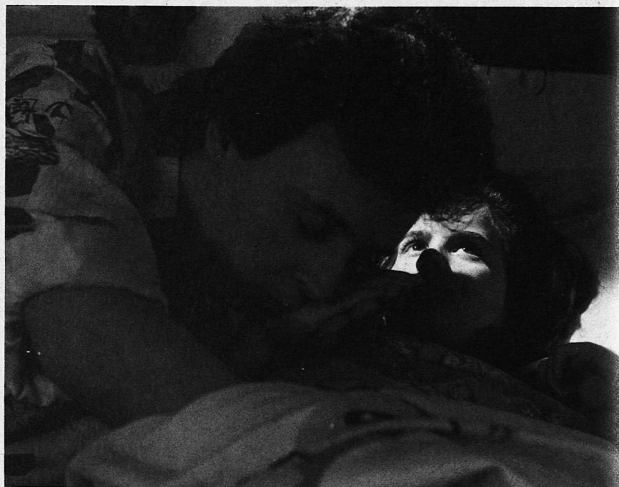
«Onkel Beat war nie hier.»

Das Video ist beim kantonalen Lehrmittelverlag an der Ringstrasse 34 in Chur (Tel. 21 22 66) kostenlos leihweise erhältlich. Dort kann es auch vorvisioniert werden. Als Kommentar wurde eine Mappe mit diversen Zusatzinformationen und Broschüren zusammengestellt.