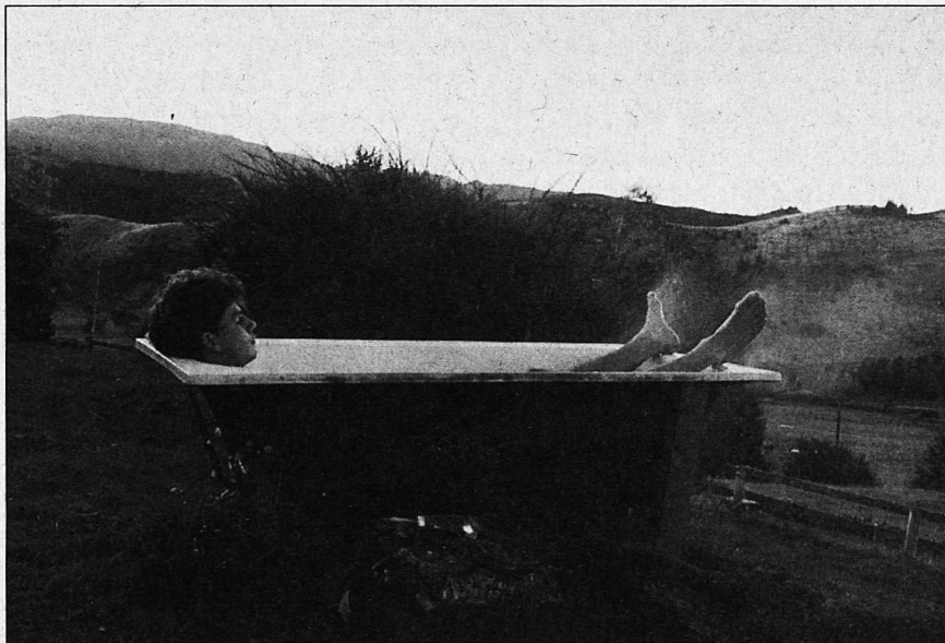
Die Stärkung von Kraft und Wohlbefinden als Ziel...

Es könnte demnach bestenfalls eine symptomkämpfende, kurzfristige Notmassnahme sein, eine Lehrerinnen- und Lehrerberatungsstelle mit einem bloss auf Krisenintervention ausgerichteten Auftrag einzurichten. Besser wäre es, von einem generellen Unterstützungskonzept für Lehrkräfte und Schulen auszugehen, welches dann den Grossteil der Krisen im Ansatz