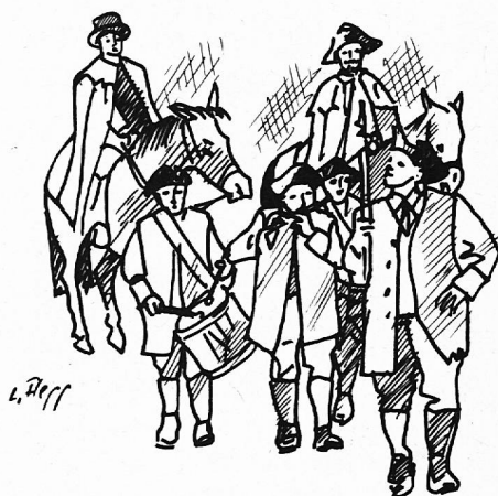
Cumin dalla Cadi