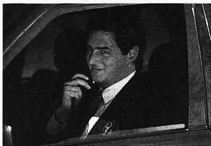
Dichtung und Wahrheit bei der Berufswahl.

Die Enttäuschung über die engen Wahlmöglichkeiten einerseits und das Festhalten an idealisierten Bildern und Traumberufen andererseits kommen zum Ausdruck.