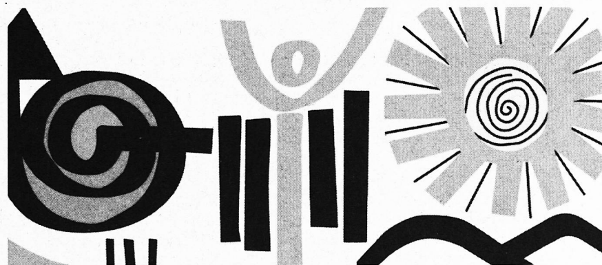
Schweizerische Lehrerinnen- und Lehrerbildungskurse Bodensee 10.-28. Juli 1995.

Das Erziehungs-, Kultur- und Umweltschutzdepartement hat diese Vorschläge akzeptiert und sie als neue Regelung mittels Departementsverfügung ab 1. Januar 1995 in Kraft gesetzt.