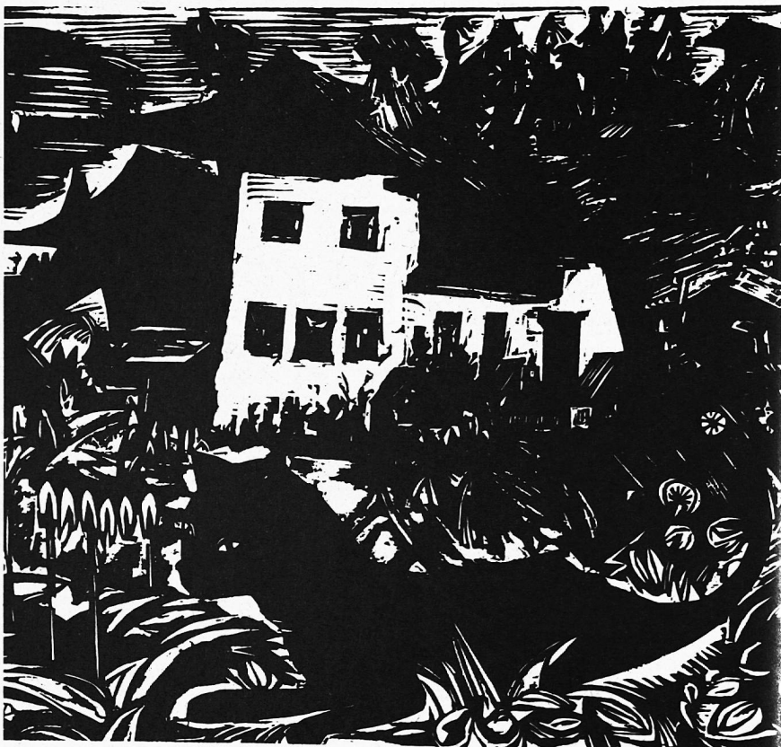
Ernst Ludwig Kirchner: Weisses Haus in Wiesen.

Eine Neugestaltung der Zeugnisse für die Volksschul-Oberstufe drängte sich als Folge der neuen Lehrpläne für die Real- und Sekundarschulen auf. Die neuen Zeugnisse sind im Loseblatt-System und in Computer-Version gestaltet, welche auch eine einfache Notenverwaltung ermöglicht.