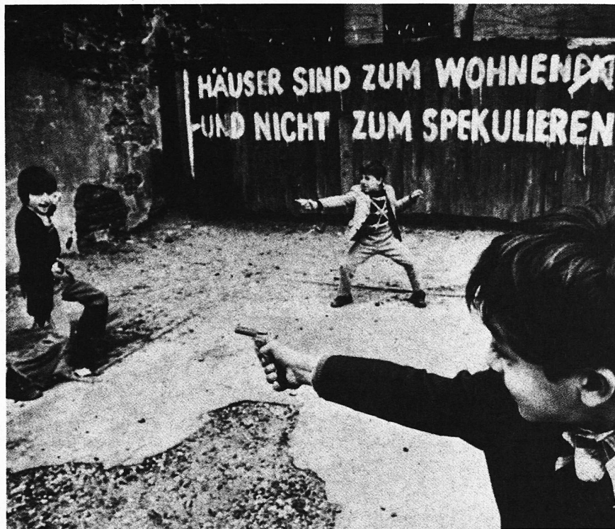
James Bond, Rambo oder Zoro?

Ein weiteres Problem ergibt sich durch die elektronischen Medien. Früher wurde der Fernsehkonsum der Kinder noch weitgehend durch die Programmstrukturen der einzelnen Sender bestimmt. Heute werden wegen der Videorecorder alle Sendungen universell verfügbar, dazu kümmern sich die rein kommerziellen Sender kaum darum, welches Publikum zu welcher Zeit vor dem Fernseher sitzt. So geht die Kontrollmöglichkeit der Eltern verloren, die Kinder «ziehen sich rein» was ihnen passt und orientieren sich dann oft an aggressiven Vorbildern. Zudem führt das Fernsehen zu einer Einschränkung der Aktivität und der Kreativität.