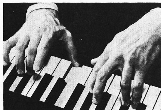
Achtung Musik- und andere Konserven sind gesetzlich geschützt.

An Computerprogrammen (Software) besteht ein grundsätzliches und umfassendes Kopier- und Verleihverbot. An jedem Arbeitsplatz von Lehrkräften und Schül- kindern darf nur lizenzierte Software eingesetzt werden.