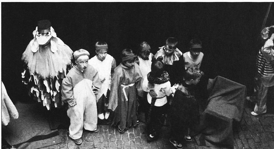
«Kinder spielen für Kinder».