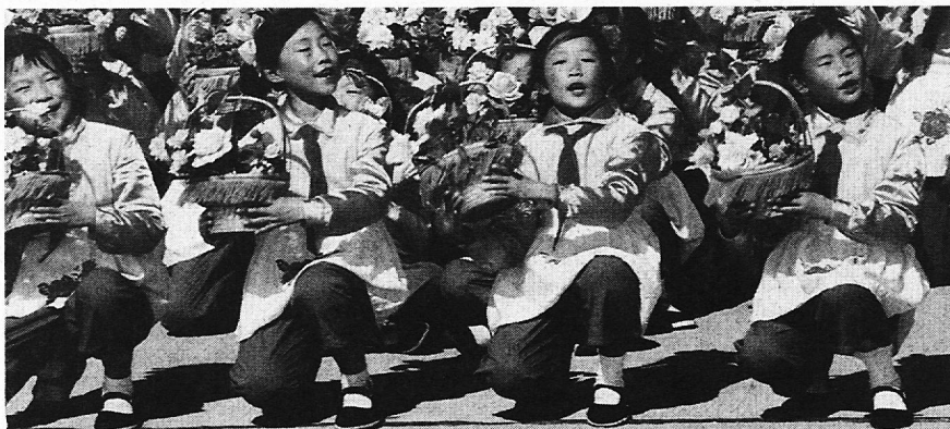
Mit Kindern aus andern Ländern aktiv kommunizieren

Zur Teilnahme am Kulturlager sind Schulklassen der Sekundarstufe I (Oberstufenklassen) aller Kantone eingeladen. Voraussetzung ist das Interesse an Kultur, Globalem Lernen, internationaler Kommunikation und Kinderrechten. Ein entsprechendes Auswahlverfahren soll gewährleisten, dass die Klassen aus möglichst vielen verschiedenen Kantonen stammen. Pro Lagerwoche kann je eine Klasse pro Sprachregion (d.h. insgesamt vier) mit je