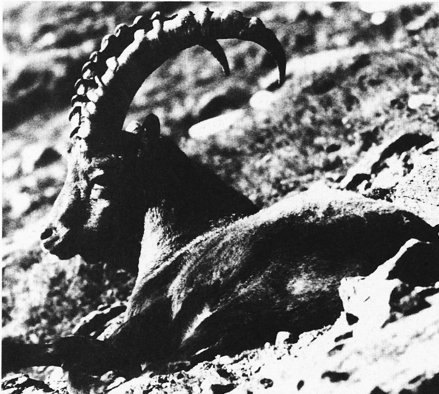
«Jubiläums- und Wappentier»

Öffnungszeiten: Dienstag bis Samstag, 10.00 bis 12.00 und 13.30 bis 17.00 Uhr, Sonntag, 10.00 bis 17.00 Uhr durchgehend, Montag geschlossen.