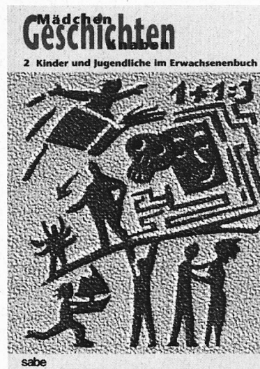
Textband 2, Kinder und Jugendliche im Erwachsenenbuch