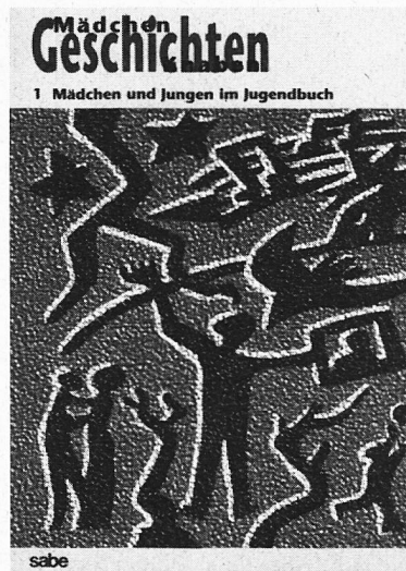
Textband 1, Mädchen und Jungen im Jugendbuch

sabe, Verlagsinstitut für Lehrmittel, Tödi-strasse 23, 8002 Zürich, Telefon 01 202 44 77, Telefax 01 202 19 32