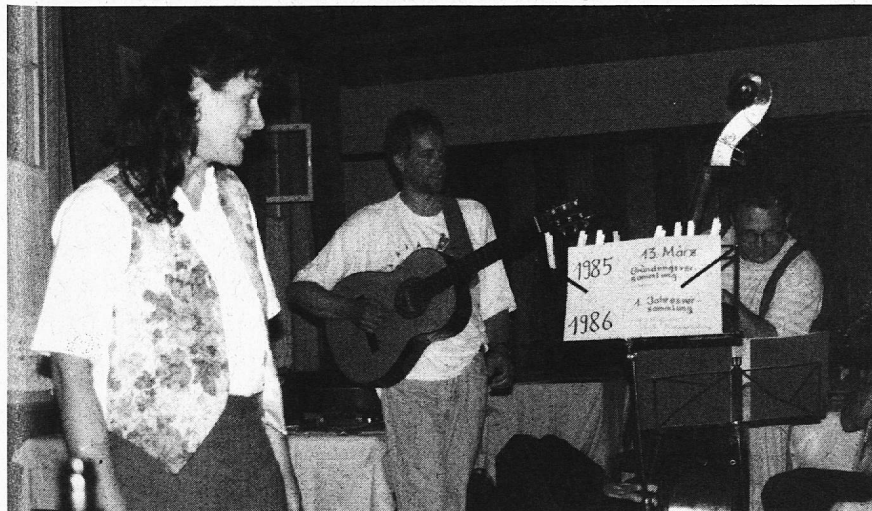
10 Jahre BÜLEGA

10 Jahre BÜLEGA! Wir haben gelernt, Probleme anzugehen und uns mit fachlichen und persönlichen Schwierigkeiten auseinanderzusetzen. Diese Entwicklung hat uns stark gemacht, und wir gehen mit Überzeugung unsern Weg weiter.