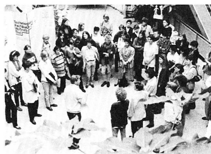
Gewerbe- und Hauswirtschaftslehrkräfte tagten in Dottikon

«Statt lamentieren – argumentieren und handeln» war denn auch die Devise. Sei es durch wirksame Medienarbeit, weitreichende Public Relations und öffentliches Thematisieren der berufsspezifischen Problematik einerseits oder aber sicheres und überzeugendes Auftreten andererseits. Die Ansatzmöglichkeiten zur eigenen Imagepflege und zu einer effizienten Aufwertung der Hauswirtschaft sind weitreichend. Einen weiteren Schritt in diese Richtung wurde mit der Durchführung dieser Veranstaltung vollzogen. Die Lehrkräfte für diesen Bereich sind in Bewegung und prägen die Entwicklung von heute mit. Nach der ersten Tagung in Bern vor vier Jahren ist ein weiteres Etappenziel erreicht, auf das wir alle stolz sein können.