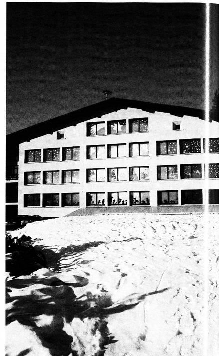
Unsere Weihnachtsprojekte sind mehr als eine schöne Fassade, wir wagen uns auch an schwierige Themen

Mit dem 1. Schultag beginnt auch mit dem Bus eine Reise in eine neue Realität. Auf der Lenzerheide heisst es nun für die Valbellner Erstklässler eintauchen und sich einordnen in eine Masse von rund 250 Kindern, was am ersten Schultag doch verwirren kann.