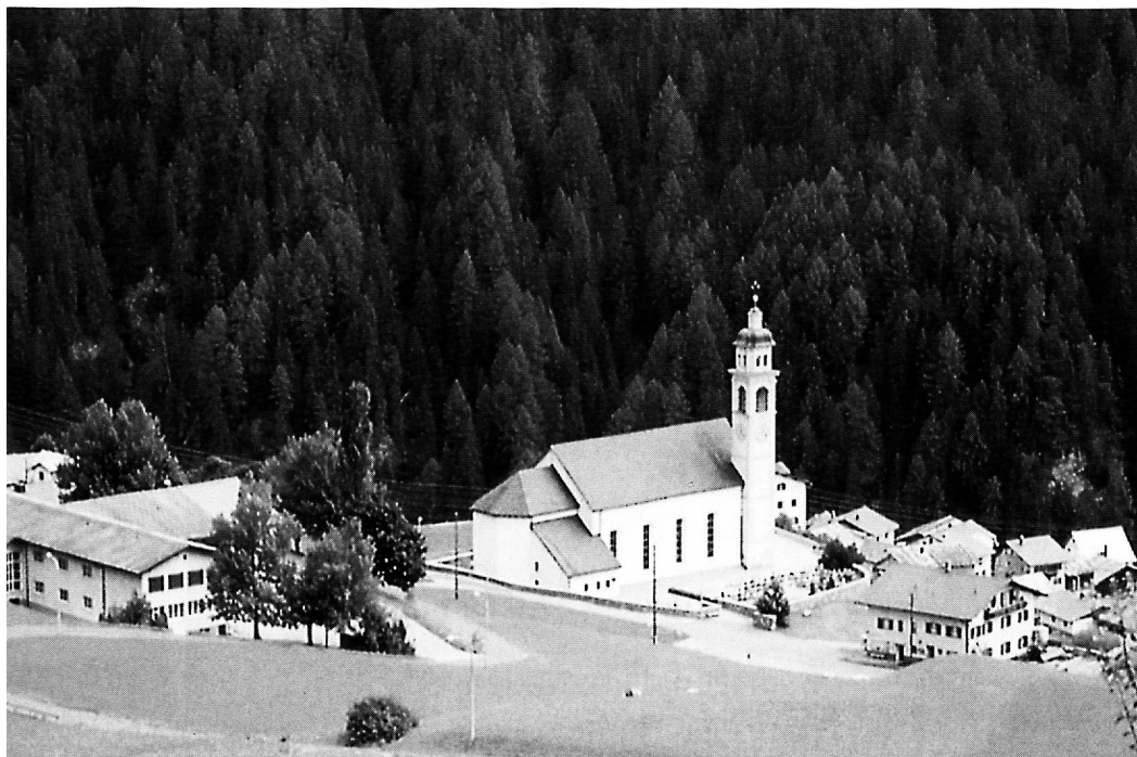
Ein Zentrum in der Gemeinde: die Gemeindekanzlei (einstiges Schulhaus), die Pfarrkirche und das Schulhaus in Zorten.

Im Spannungsfeld zwischen Tradition und Innovation führen wir in unserer Gemeinde ein vielfältiges Schulleben.