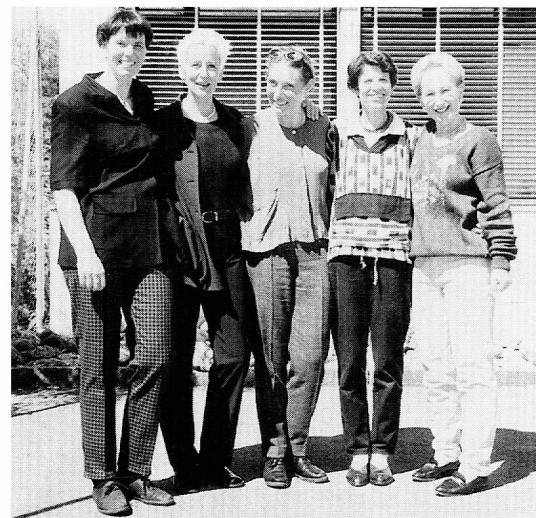
Workshopleiterinnen der Legastheniegruppen