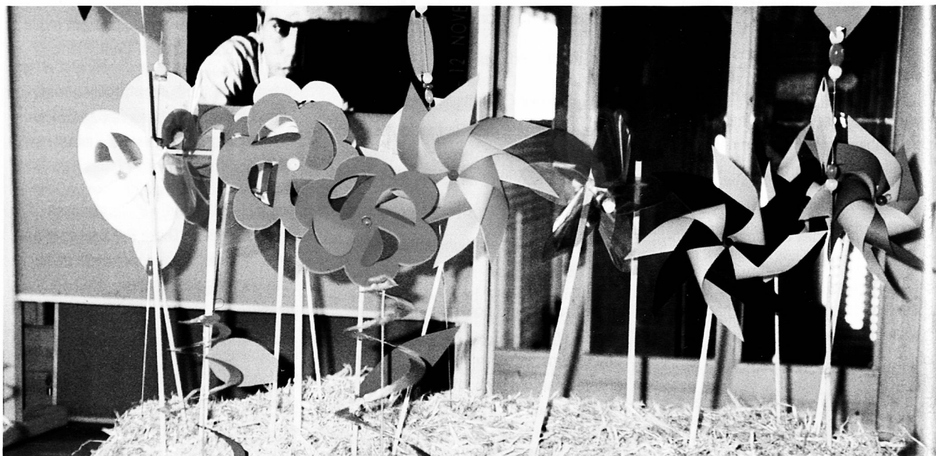
Es weht ein neuer Wind...

Liebe Lehrerinnen, liebe Lehrer, die Gesellschaft braucht Sie.