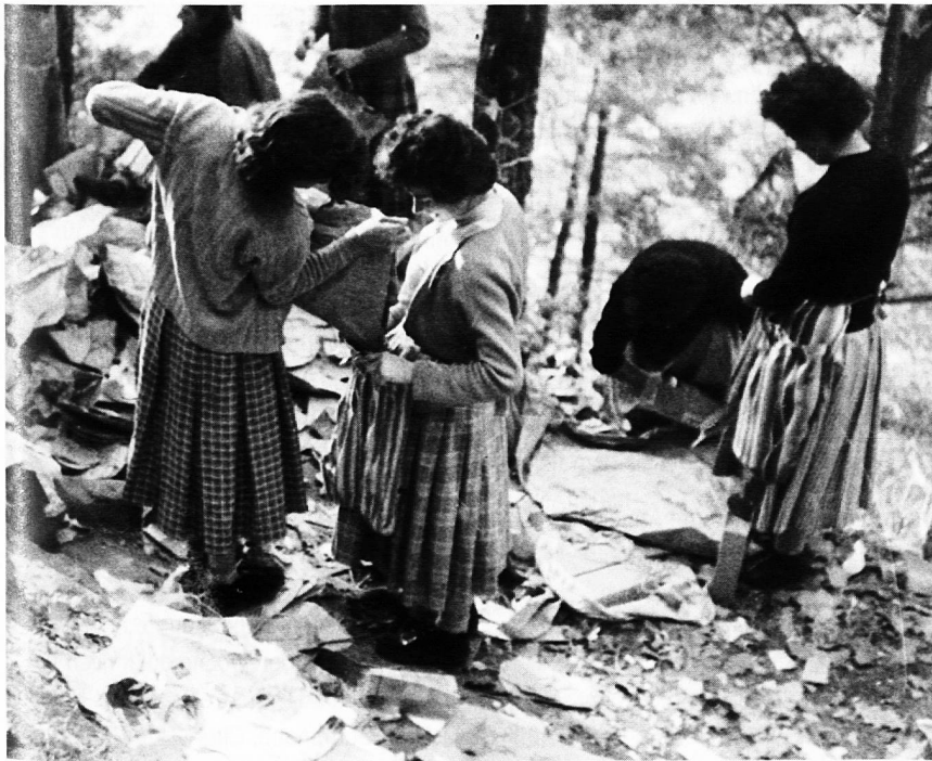
Schmuggel zwischen Puschlav und Veltlin, sechziger Jahre. Von Brusio wurde die Ware (meist Kaffee oder Zigaretten) von Schweizern nach Viano oder Cavaione hinaufgefahren. Vom Schweizer Zoll war bei der Warenausfuhr nichts zu befürchten. Das heikelste Wegstück beidseits der Grenze bewältigten dann meist Veltlinerinnen und Veltliner, zu Fuss, mit oder ohne Maultiere. In der Mitte der Abbildung füllt die eine Frau der anderen Kaffee in einen Behälter, den diese sich um den Leib binden und dann unter Pullover und Rock verstecken wird.

Martin Flütsch hatte die Fragebogen zum Fremdsprachenkonzept ausgewertet. Es zeigte sich folgendes Bild: