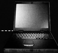
MAXDATA Pro 700T