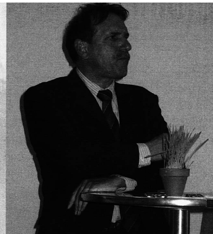
Regierungsrat Claudio Lardi

«Er ist die Empfehlung, die humanistische Orientierung der Bildung durch das Paradigma der Ökonomie zu ersetzen. Oder etwas plakativ und böse ausgedrückt, ist es der Ratschlag, Humboldt durch Christoph Blocher zu ersetzen.»