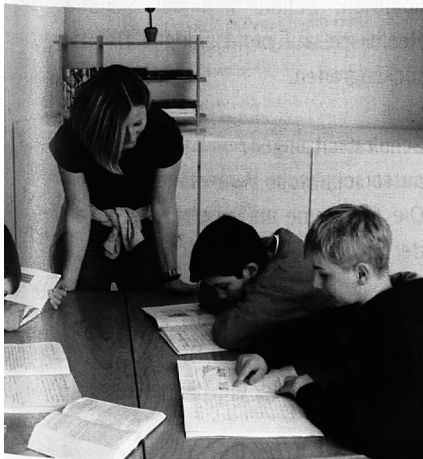
Die Schülerinnen und Schüler lassen sich bei den Hausaufgaben gerne von der Betreuerin helfen.