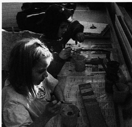
Auf Anfrage bekommen die Kinder Werkmaterial

Nach ein paar Tagen wird das Pferd immer seltener benutzt und die 3 Mädchen verschenken es weiter. Die neuen Besitzer wollen das Pferd auch bewegen, und haben die Idee mit den Teppich-Hufen. Doch mit stossen allein bekommen sie das grosse Pferd kaum vom Fleck. Ein Seil muss her, das ist klar, aber es braucht ein paar Versuche, um herauszufinden, wo man das am besten befestigt. Einmal kippte das Pferd sogar samt Reiter um. (Zum Glück ist nichts Schlimmes passiert.) Aber das schreckt die Kinder nicht ab. Nun wollen alle einmal einen Ausritt machen, und so verwandelt sich unser Kindergarten in eine Reitschule.