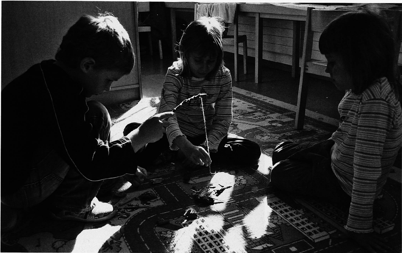
Spielen mit dem selbst gemachten Angelspiel

zu beitragen, die Kinder zu stabilen Persönlichkeiten zu machen – so dass sie in der Lage sind, bewusst «JA» und «NEIN» zu sagen und ihr Selbstbewusstsein und ihr Selbstvertrauen gestärkt wird.