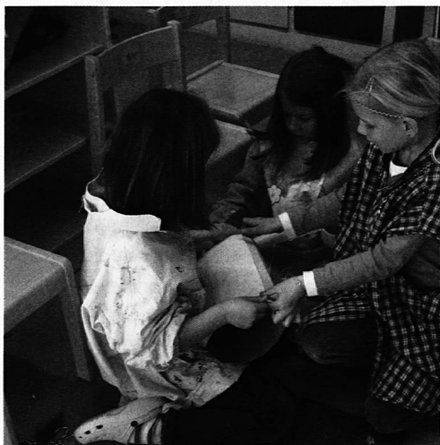
Nur mit wenig Unterstützung von mir gestalten die Mädchen ihren Pferdekopf

Durch das Projekt sollen die Kinder die Grundidee des Spielens erst wieder erlernen, beziehungsweise neu entdecken. Anfangs stehen ihnen «nur» Möbel, Kissen und Tücher zur Verfügung. Je nach Ideen oder Initiative der Kinder wird das Angebot vergrössert und es kommen vielleicht Bastel- oder Naturmaterialien dazu. So erleben sie Freude am Spiel und am «Miteinander-Tun». Sie sollen etwas Neues aus sich selbst heraus schaffen. Dann steht wieder schöpferische und fantasievolle Kreativität im Vordergrund. Die Kindergartenlehrperson steht den Kindern als Helferin zur Verfügung, hält sich aber mit Vorschlägen und Einschränkungen zurück. Diese Zeit soll da-