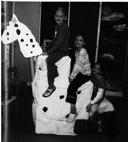
Das Triopferd und die stolzen Erbauer