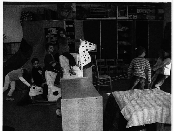
Reitschule auf dem selbst gebastelten Pferd

«Gock, Gock, Gock», hört man einen Jungen auf einem Stuhl gackern. In der Tischhütte darunter sitzen 2 Kinder, und schauen sich «Ups, die Pannenshow» an. «Grüezi, meine Damen und Herren...», ein Kind übernimmt die Rolle des Fernsehers. «Gock, Gock», das Huhn schüttelt sich und ich glaube, es versucht ein Ei zu legen. Irgendwann kommt Batman aus der Hütte