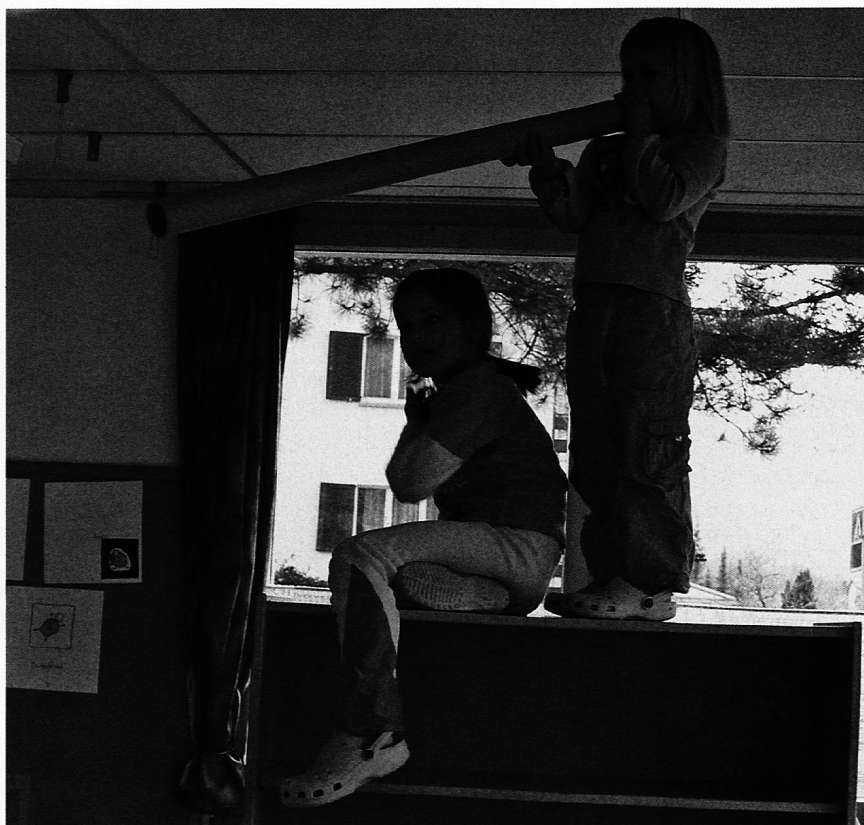
Nachrichten durchs Radiorohr