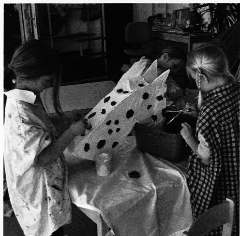
Nach dem Kleistern kommt das Bemalen des Pferdekopfes