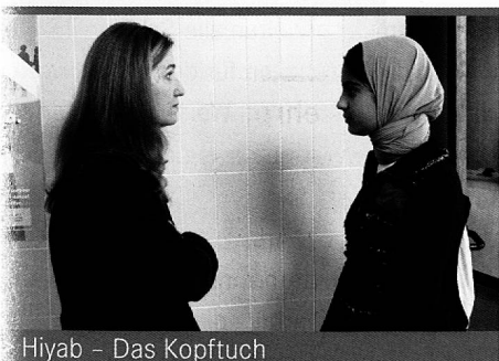
Hiyab – Das Kopftuch