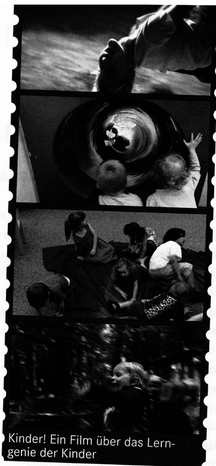
Kinder! Ein Film über das Lerngenie der Kinder

Vision und Pragmatismus verbinden sich zur Stärke dieser Schule. So entsteht die Atmosphäre für das Entscheidende: Die Zusammenarbeit der Lehrer. Jede Woche sitzen sie an einem Nachmittag zusammen, analysieren ihre Probleme und versuchen sie in Lösungen umzuwandeln. Hier wird auch entschieden, welcher Kollege zu welcher Fortbildung geht und welche Expertinnen in die Schule geholt werden. So entsteht Arbeitsteilung. Eine Lehrerin zum Beispiel sucht nach Anregungen, wie Kindern Naturwissenschaft nahe gebracht werden kann. Sie hat die Ideen