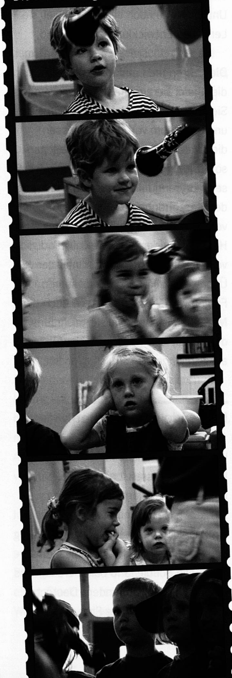
Die Entdeckung der frühen Jahre

Kooperation angewiesen. Sie sind eher unternehmerisch, jedenfalls sind sie keine pädagogischen Untermieter in einem angeblich übermächtigen System. Es sind tatsächlich lernende Schulen. Und die Hauptakteure dabei sind die Lehrer.