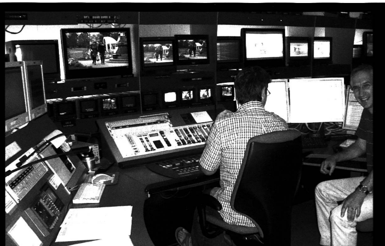
Da hat man gut lachen. Endlich wird die fertige Sendung ausgestrahlt und die Sendeleitung sorgt dafür, dass alles passt.