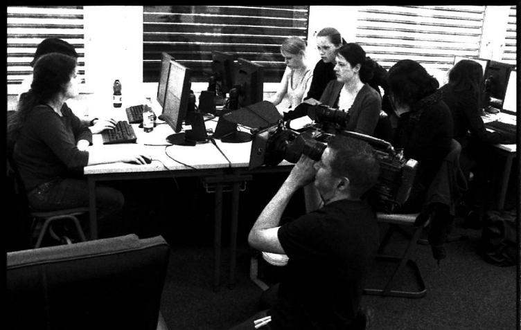
Dreharbeiten in der Berufsschule Winterthur für das Berufsporträt «Buchhändler».