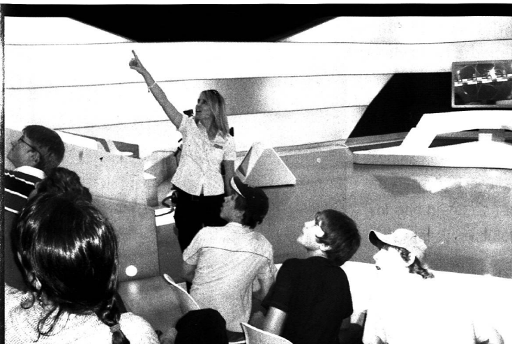
Eine Führung für eine Schulklasse durch das Fernsehstudio. Der Praktikant begleitet eine ehemalige Schülerin aus Thusis, die jetzt beim Fernsehen arbeitet.

Das Schweizer Fernsehen hat gemäss Konzession den Auftrag, bildende Inhalte zu vermitteln. Ich denke, dass dieser beim Schulfernsehen auf unterhaltsame, aber qualitativ hochstehende Art erfüllt wird. «SF Wissen mySchool» sendet pro Jahr rund 220 Stunden Programm, bestehend aus mehreren hundert Beiträgen. Davon können alle Schulen kostenlos profitieren. Ich bin froh, während meines Praktikums einen Beitrag an diesen Service geleistet zu haben.