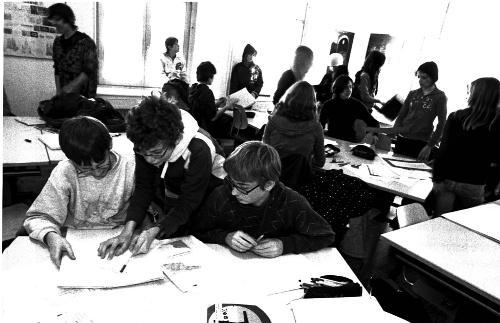
Respekt – die Klasse 2c der EMS an der Arbeit

Vor einem Jahr haben wir im Bündner Schulblatt das Projekt «Museum & Schule» (M&S) vorgestellt. Das Projekt von Museen Graubünden gibt Schulklassen die Möglichkeit, in einem Museum zu einem selbst gewählten Thema eine Ausstellung zu realisieren. Die beteiligten Lehrpersonen und Museumsleiter haben im Verlaufe des Jahres 2008 an drei Impulstagen durch Fachleute eine Anleitung erhalten. Nun geht das Projekt in die Realisierungsphase.