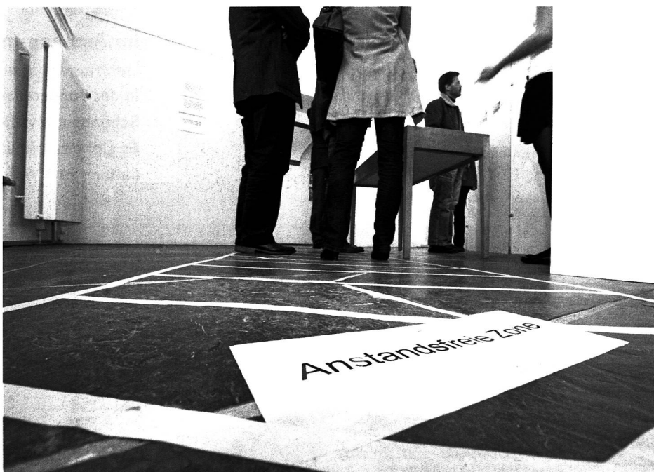
Die Ausstellung «Respekt» beleuchtet Aspekte der Persönlichkeit