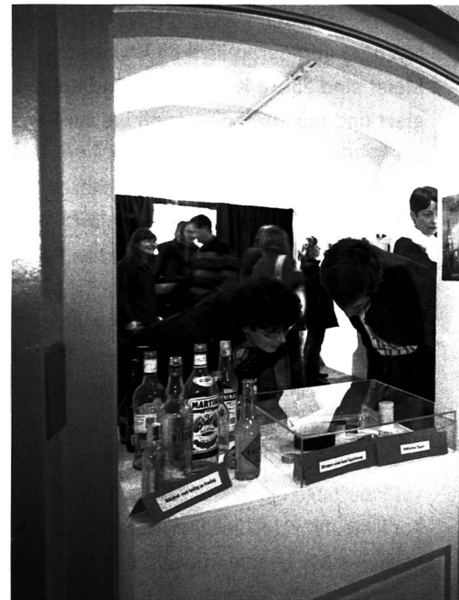
«Gut gemacht», war der Kommentar der Eltern an der Vernissage

und Zeichnen mit den Recherchen zu dieser Ausstellung. Sie besuchte zur Inspiration die neuen Dauerausstellungen im Rätischen Museum und im Bündner Naturmuseum. Die Schülerinnen und Schüler übernahmen weitere Aufgaben wie: Medienarbeit, Sponsoring, Plakatgestaltung und Präsentation. Bei der Einrichtung der Ausstellung erhielten sie Unterstützung durch die Ausstellungsgestalter C. Gasser und R. Derungs, die das Projekt M&S seit Beginn begleiten. Jede Schulklasse darf ein individuelles Coaching in Anspruch nehmen. Die Vernissage vom 27. Februar in Grüşch wurde auf der Bühne des Kellertheaters von der Theater-Projektwoche mit einer Interpretation des Themas «Grenzfall» einge-