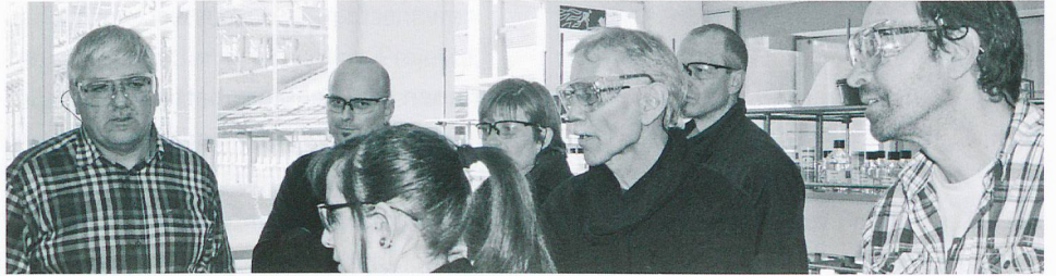
Das Tragen von Schutzbrillen gehört im Labor zur Selbstverständlichkeit.