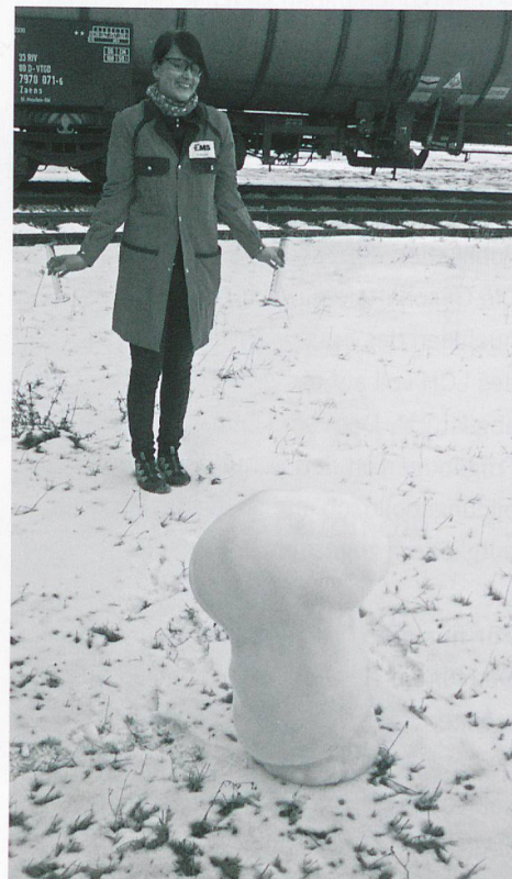
Aus Wasserstoffperoxid, Kaliumiodidlösung sowie Spülmittel lässt sich eindrucksvoll «Elefantenzahnpasta» herstellen.

Der erste Nachmittagsblock bringt Versuche zur Lumineszenz sowie solche, die im Freien durchgeführt werden sollten. Der dritte Block findet wiederum im Labor statt, wo Versuche gezeigt werden, die aufwendigere Versuchsaufbauten verlangen wie Dampfdestillation, Extraktionsanlage, Chemie-Gaskapelle usw. Versehen mit einem USB-Stick voller Unterlagen und vielen Impulsen zu Experimenten, die sich im Schulalltag gut durchführen lassen, blicken die Teilnehmenden auf einen sehr gelungenen Kurstag zurück.