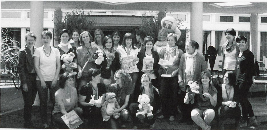
Die Bündner Schulzahnpflege-Instruktorinnen, Fortbildungsanlass Mai 2014.