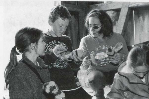
Schülerinnen und Schüler im Fachgespräch mit einer Studentin der PHGR. Momentaufnahme im Rahmen eines künstlerischen Projekts in einem nicht mehr gebrauchten Stall.