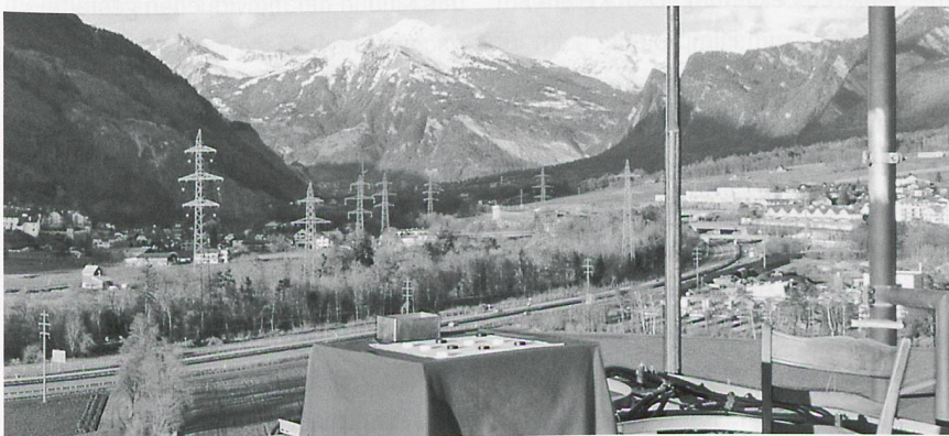
«Windmühle» – eine Installation von Studierenden der PHGR auf dem Rheinmühlturm am Stadtrand von Chur.