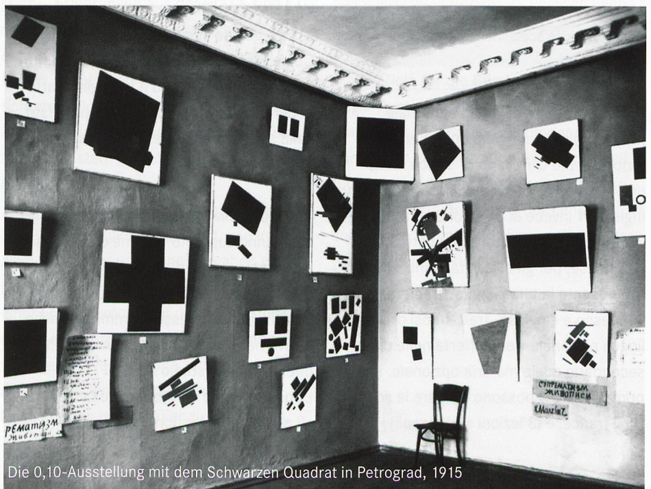
Die 0,10-Ausstellung mit dem Schwarzen Quadrat in Petrograd, 1915

Infos und Anmeldung: www.legr.ch/news/tagungen