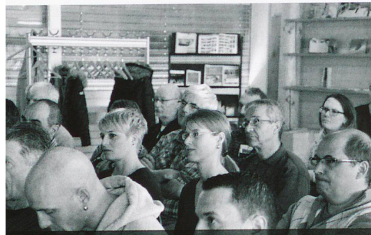
Rund 40 Oberstufenlehrpersonen informierten sich über die Berufe im öffentlichen Verkehr.