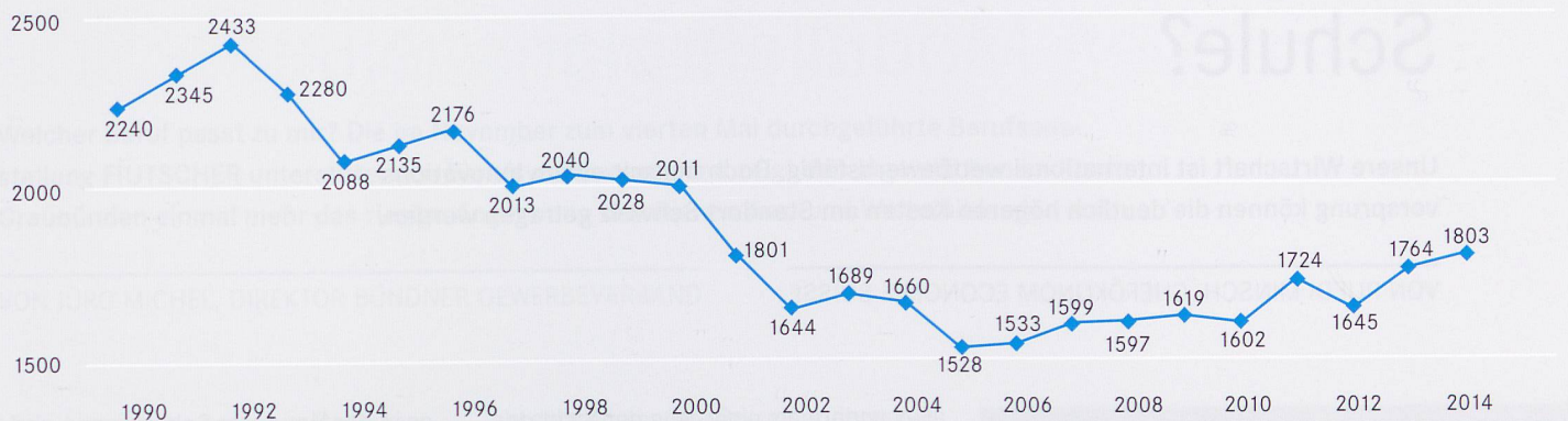
Diagramme: Amt für Berufsbildung (AfB)

Kampagne Berufsbildung plus am Laufen. Die Durchlässigkeit ist heute in einem hohen Masse gewährleistet. Die höhere Berufsbildung bietet ganz viele Weiterbildungsmöglichkeiten bis zur Hochschule und sehr gute Perspektiven auf dem Arbeitsmarkt an.