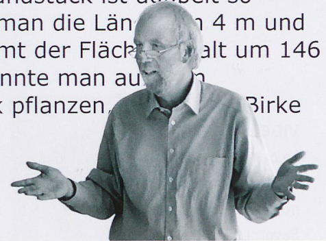
Prof. Dr. Kurt Reusser

Ein rechteckiges Gartengrundstück ist doppelt so lang wie breit. Verlängert man die Länge um 4 m und die Breite um 5 m, so nimmt der Flächeninhalt um 146 m 2 zu. Wie viele Birken könnte man auf dem ursprünglichen Grundstück pflanzen, wenn eine Birke 4 m 2 Land benötigt?