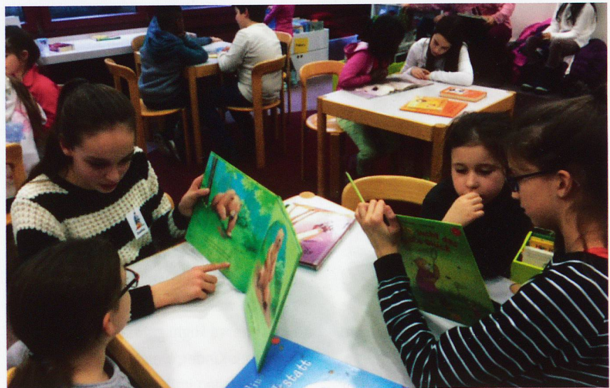
Lesegotten und Lesegöttis lesen mit ihren Gottenkindern.

Pro Jahr finden 20 Leseplatzveranstaltungen statt. 10 Mal im Jahr wird jeweils am Donnerstag von 17.00 – 19.00 Uhr ein Leseplatz durchgeführt. Der Leseplatz ist absichtlich ausserhalb der Schulzeit eingerichtet, damit die Kinder extra kommen und sich bewusst für die Teilnahme entscheiden müssen. Gewöhnlich findet er in der Schulbibliothek statt. Die Kinder müssen sich nur anmelden, wenn er ausserhalb des Schulhauses, z.B. im