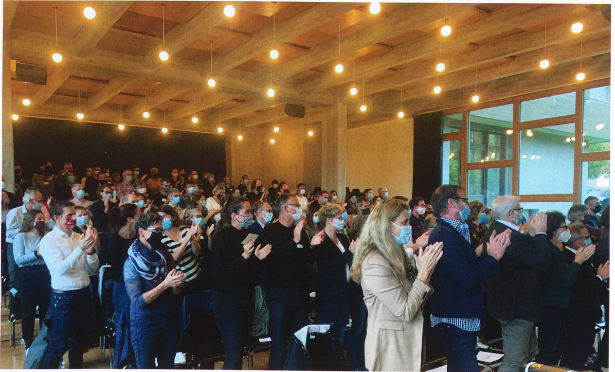
Die bisherige Präsidentin wurde unter anderem mit einer Standing Ovation zum Ehrenmitglied des LEGR erhoben.

VON JÖRI SCHWÄRZEL, LEITER DER GESCHÄFTSSTELLE LEGR