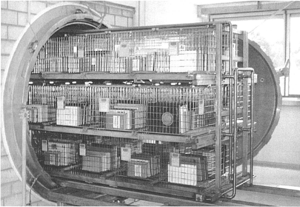
Einfahrt des Behandlungsgutes. Ein Korb fasst rund 0,5 Lfm Bücher.

karischen mit der konservatorischen Bewertung des Zustandes. Das heisst, es werden ein Bestand, eine Sammlung oder eine Signaturenreihe nach materialspezifischen und inhaltlichen Aspekten für die Massenentsäuerung ausgewählt und gesamthaft behandelt. Einzelselektion soll aus Kostengründen vermieden werden.