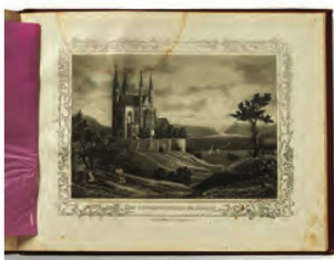
Illustration im Album des Rheins , ca. 1860

Die Plattform der digitalisierten Zeitungen, e-Newspaperarchives.ch , verzeichnete knapp 215'000 Aufrufe, was einer Zunahme von 41% im Vergleich zum Vorjahr bedeutet. Das für die Bildanzeige wichtige International Image Operability Framework iiof wurde im April 2019 als Standard auf e-Newspaperarchives implementiert. Im November wurde erfolgreich eine Crowd-Sourcing Aktion durchgeführt: Rund 130 interessierte Personen korrigierten anlässlich des 60. Jahrestages der Ablehnung des Frauenstimmrechts 72'408 Zeilen aus digitalisierten Zeitungsartikeln. Neu sind Zeitungen aus den Kantonen Jura und Bern auf der Plattform aufgeschaltet. Weitere Titel sind die Engadiner Post und historische Zeitungen zum Thema Anarchismus. Mit Tamedia und der NZZ konnten zudem erfolgreiche Partnerschaften für die Digitalisierung der Tribune de Genève , von La Suisse und der Neuen Zürcher Zeitung initiiert werden.