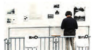
Fotografieren mit Drohnen