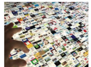
Die Benutzeroberfläche des Katalogs e-Helveticat Access