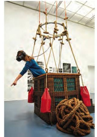
Mithilfe einer Virtual-Reality-Brille konnten die Ausstellungsbesuchenden eine Ballonfahrt in virtueller Realität erleben

In der NB in Bern nahmen 7632 Personen an Kulturveranstaltungen teil, deutlich weniger als 2018, welches mit der Ausstellung LSD. Ein Sorgenkind ein Ausnahmejahr war. Die Ausstellung Von oben. Spelterinis Ballon und die Drohne ermöglichte auf der Grundlage der NB-Sammlungen eine Ballonfahrt in der virtuellen Realität.