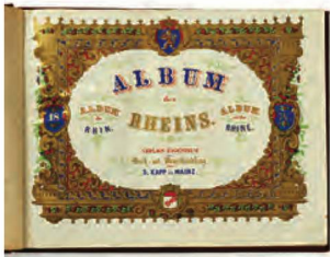
Titelseite des Werks Album des Rheins , ca. 1860

Eine grosse Anzahl Objekte wurde extern konservatorisch bearbeitet. Es handelte sich insbesondere um Glasnegative, die für die Digitalisierung vorbereitet wurden, und um die Behandlung schimmelhaltiger Objekte aus zwei neu erworbenen Nachlässen des Schweizerischen Literaturarchivs. Das Projekt COPHOT, das zum Ziel hatte, die Erhaltung der gesammelten Fotografien in Form von Kühl- und Kaltlagerung zu verbessern, wurde nach Abschluss der Konzeptphase abgebrochen. Die speziellen Anforderungen an die Kühl- und Kaltlagerung müssen im Zusammenhang mit der langfristigen Gebäudeplanung erfolgen.