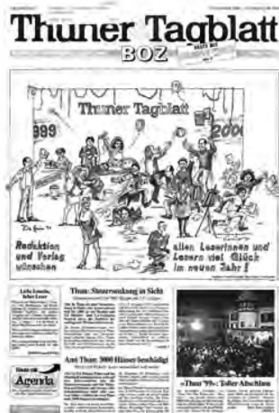
Thuner Tagblatt vom 31.12.1999

Die Aktivitäten und Ergebnisse der Allgemeinen Sammlung waren von den folgenden drei Faktoren besonders geprägt: Der Arbeit mit dem neuen Bibliotheksverwaltungssystem, den Auswirkungen der Gebäudesituation und der Ausrichtung der Aktivitäten auf die neue Strategie (gültig ab 2020).