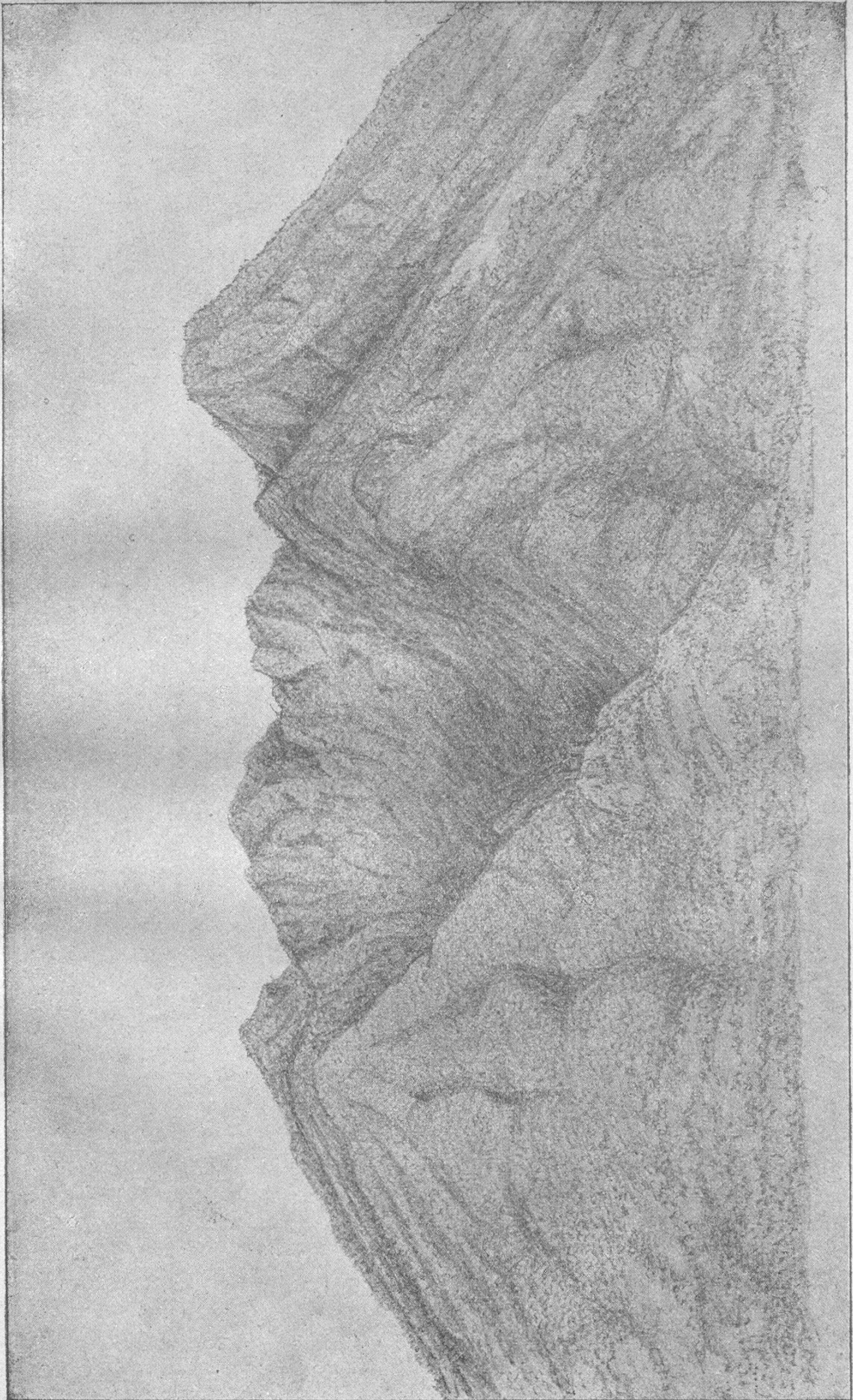
Der Salak (Java) von Buitenzorg aus. Nach einer Skizze meines Reistagebuches.