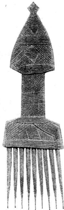
Abb. 15. Holzkamm.

2. Kamm , aus gelblichem Holz geschnitzt, mit neun etwas divergierenden Zinken, mit flachem Handgriff und breitem dreieckigem Endstück, beidseitig in ziemlich primitiver Technik mit Kerbschnitten verziert. Motive : Bandmuster, Perlung. (In äusserer Form und Dekor ähnliche Typen scheinen auch im Seen-Hochland, Britisch-Kenia, verbreitet zu sein). Abb. 15.