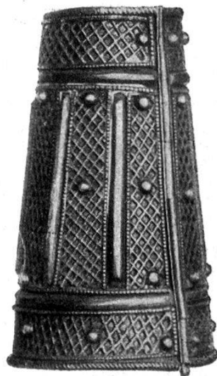
Abb. 14. Silberne Armmanchette.

Hohe Würdenträger und verdiente Krieger erhalten vom Negus als Würde- und Ehrenzeichen die Bitwa , eine stulpenförmige, konische Manchette, die in ähnlicher Weise gearbeitet ist wie die Armbänder. Die goldene Bitwa wird in der Regel nur Fürsten verliehen (Abb. 14).