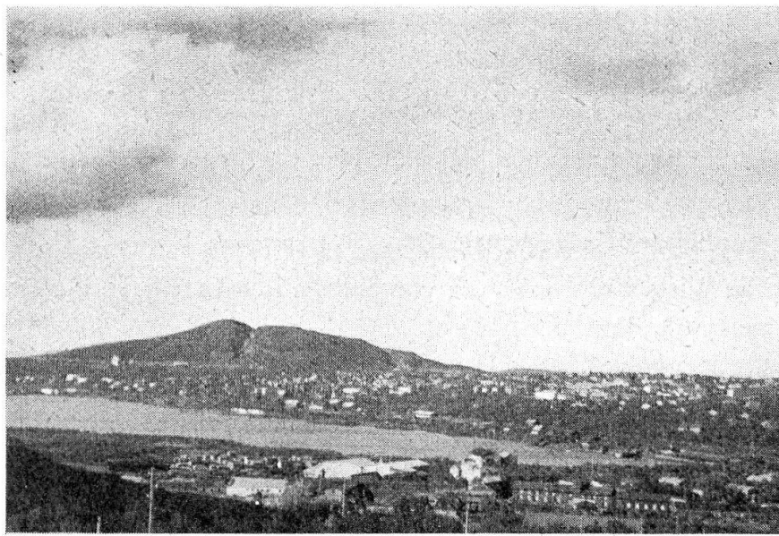
Aufnahme II: Luossavaara mit Kiruna und Luossajärvi vom Kirunavaara aus. Im Vordergrund Verwaltungsgebäude der Bergwerksgesellschaft. 1948.

Der Abbau erfolgt nach modernsten technischen Gesichtspunkten und mit neuzeitlichen Maschinen. Neben rein wirtschaftlichen Überlegungen zwingt auch der Arbeitermangel dazu. Die Ortschaft Kiruna ist 1885 entstanden und dehnt sich in offener Bauweise am Südhang des Haukivaara, nordöstlich des Luossajärvis, aus. Um 1910 zählte die Ortschaft ungefähr 9000 Einwohner, schwankte dann lange