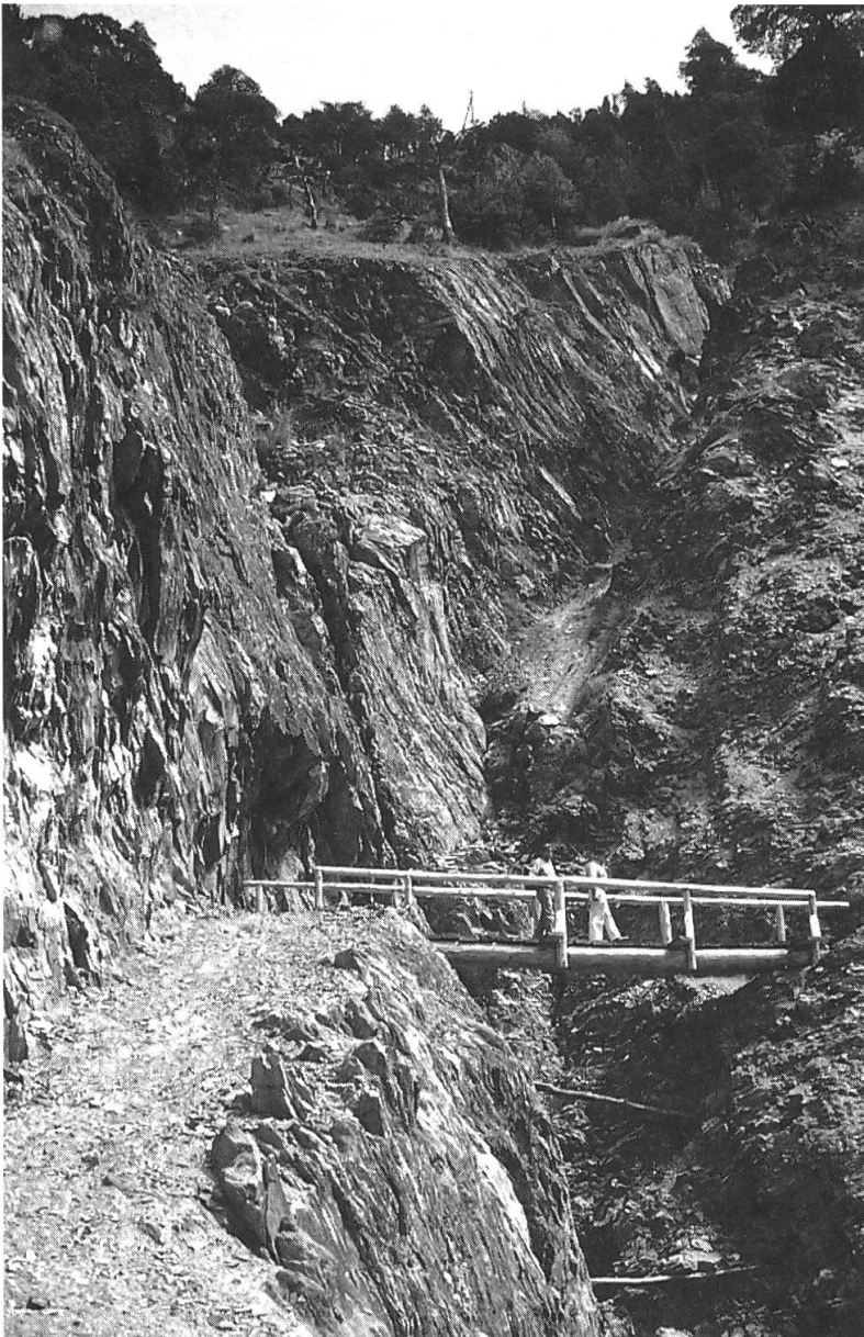
Abb. 5: Neubaustelle am Stockalperweg nördlich von Chalchofe auf 1160 m Höhe.

Der durch Erosion zerstörte Durchgang wurde durch eine ausgesprengte Halb-galerie und eine neue Holzbrücke wieder ermöglicht.