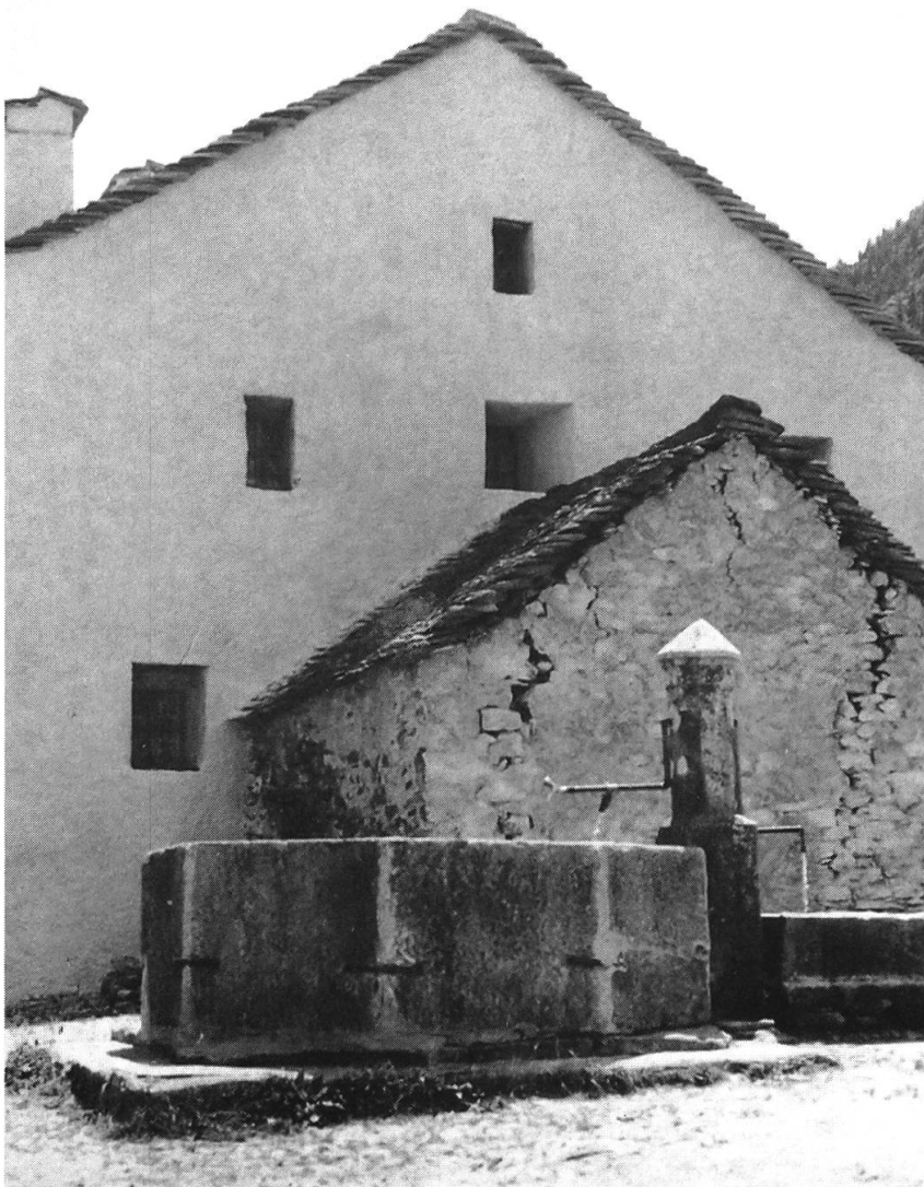
Abb. 3: Der restaurierte Alte Gasthof in Simplon Dorf als Zentrum des Ecomuseums.

Aus der Idee, den Saumpfad als Wanderweg instand zu stellen, entwickelte der Walliser Ethnologe Dr. Klaus Anderegg ein erweitertes Projekt, das in Form eines «Ecomuseums» die gesamte aussergewöhnliche Natur- und Kulturlandschaft am Simplon miteinbeziehen und touristisch nutzen sollte (ANDEREGG, 1988/2). Der Stockalperweg sollte dabei das Rückgrat des neuen Projektes bilden. Als Zentrum wurde der Alte Gasthof in Simplon-Dorf vorgesehen und entlang des Weges würden verschiedene, funktional mit dem Saumpfad verbundene Gebäude als sogenannte «Antennen» natur- und kulturgeschichtliche Themen beinhalten (Verkehrsgeschichte, Bergbau, Landwirtschaft, Flora etc.): «Alle diese Antennen sind durch ein zusam-