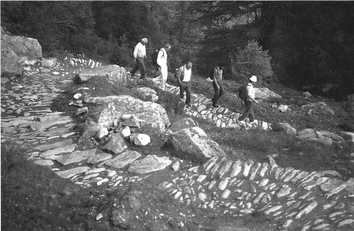
Abb. 4: Wegstück am Beginn des Abstieges von Simplon Kulm nach Norden ins Tafernatal. Die Pflasterung wurde im Sommer 1991 von Schülerinnen und Schülern freigelegt.

menhängendes Wegnetz miteinander verbunden und erwanderbar» (ANDEREGG, 1988/1: 26). Die Idee des Ecomuseums, das die Wechselwirkungen zwischen Mensch und Umwelt in ihrer historischen Entwicklung aufzeigen will, entstand gegen Ende der sechziger Jahre in Frankreich.