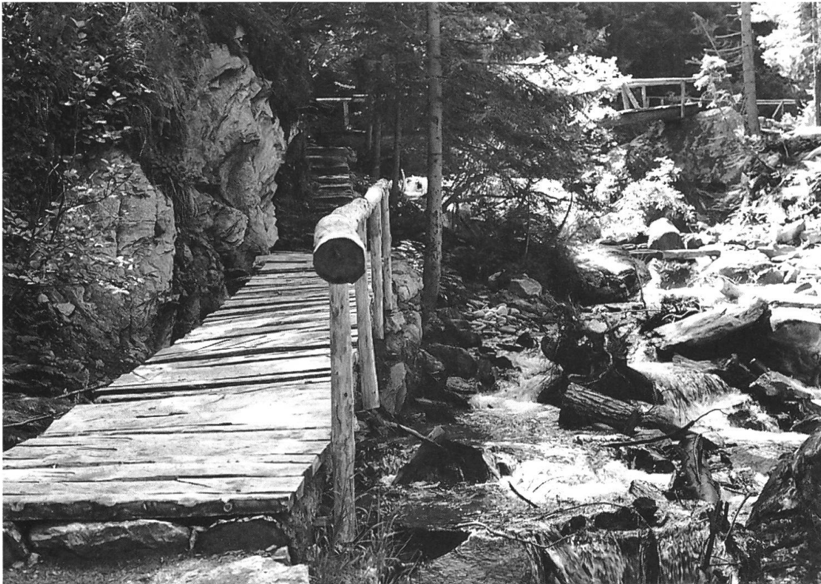
Abb. 2: Bei der Sanierung des Stockalperwegs wurden in der Tafernaschlucht neue Holzstege gebaut, die eine Passage in diesem Gebiet überhaupt erst möglich machen.

Von den historischen Strassenbauten blieb nur Stockalpers Saumpfad über eine Länge von rund 35 km praktisch unverändert erhalten. Die Anlage der Napoleonstrasse hatte sich als derart gut erwiesen, dass die Ingenieure beim Bau der Nationalstrasse über weite Teile die gleiche Linienführung wählten und damit die alte Militärstrasse mit Ausnahme einiger isolierter Teilstücke zerstörten.