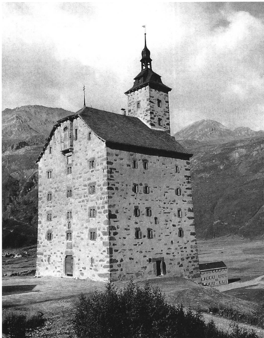
Abb. 6: Der Alte Spittel wurde von Kaspar Jodok von Stockalper anstelle eines älteren Hospizes erstellt und im Jahre 1666 vollendet. Das Gebäude gehört baulich und architekturgeschichtlich zum wertvollsten Baubestand der Region.

Die Dimensionen eines derartigen Projekts sind nicht alltäglich und bedürfen einer grossen (ideellen) Unterstützung, die weit über die betroffene Region hinausgeht. Dass das «Ecomuseum» aber für die Region Simplon einen Wert besitzt, hat sich in den vergangenen Jahren mehrfach gezeigt. Doch noch ist der wirtschaftliche Nutzen für die Bevölkerung steigerungsfähig, was in erster Linie durch Öffentlichkeitsarbeit und durch das eben erst angelaufene Marketing gefördert werden muss. Bereits jetzt