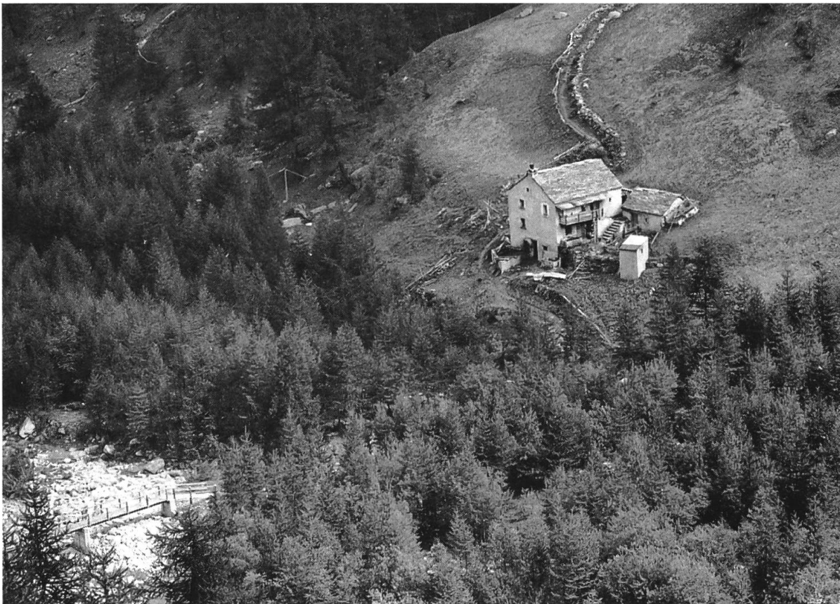
Abb. 7: Intakte Naturlandschaft und «Gsteibus» beim Gabi. Hier an der Doveria befand sich bis zu den politischen Veränderungen in der Franzosenzeit das ehemalige Gerichts- und Gemeindehaus der Kastlanei Alpien-Zwischenbergen. Beim Haus verzweigten sich die Saumwege durch die Gondoschlucht und über den Feerberg zum Furggupass nach dem Zwischenbergthal.

ist aber eine stärkere Identifikation mit den kulturgeschichtlichen Werten in der Region spürbar. Im Rahmen der Sanierungsarbeiten konnten einheimische Betriebe durch die Ausführung von Aufträgen auch schon direkt vom Projekt profitieren, und die Forstequipen konnten dank dem «Ecomuseum» mangels anderer Arbeiten wirtschaftlich schwierigere Zeiten überbrücken und aus diesem Projekt zusätzliche praktische Erfahrungen gewinnen.