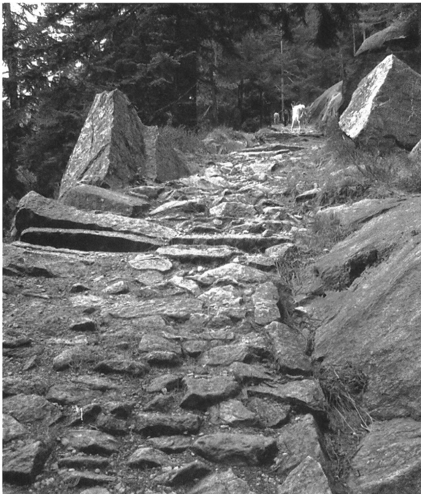
Abb. 2: Gornerenweg bei Gurtellen: Interessenabwägung zugunsten eines wunderschön gepflästerten Alpweges.

Was noch fehlt, ist einerseits eine Verknüpfung der Absichtserklärungen mit den Grundlagen des Natur- und Landschaftsschutzes und die Notwendigkeit zur Abkehr vom sektoriellen Denken nach traditionellem Muster. Bezogen auf die drei oben erwähnten Sachbereiche muss anstelle der bisherigen Tourismus-, Landwirtschafts- und Forstpolitik eine umfassende Siedlungs- und Landschaftspolitik treten, die den Absichtserklärungen in dem Sinne Rechnung trägt, dass sie die Inventare des Natur- und Landschaftsschutzes als prioritäre Grundlage einbezieht. Der Gedanke, das Bestehende in den Mittelpunkt aller raumrelevanten Tätigkeiten zu stellen, ist im übrigen nicht neu, wurde er doch vom Bundesrat bereits 1987 in seinem Raumplanungsbericht aufgenommen: «So sind beispielsweise Verkehrswege, Leitungssysteme, flächige Verbauungen, Terrassierungen usw. so zu planen, dass die die Landschaft prägenden Strukturen und natürlichen Reliefs erhalten bleiben und freie, naturnahe Landschaften vor weiteren Zerschneidungen bewahrt werden» (SCHWEIZERISCHER BUNDESRAT, 1987: Leitsatz 11).