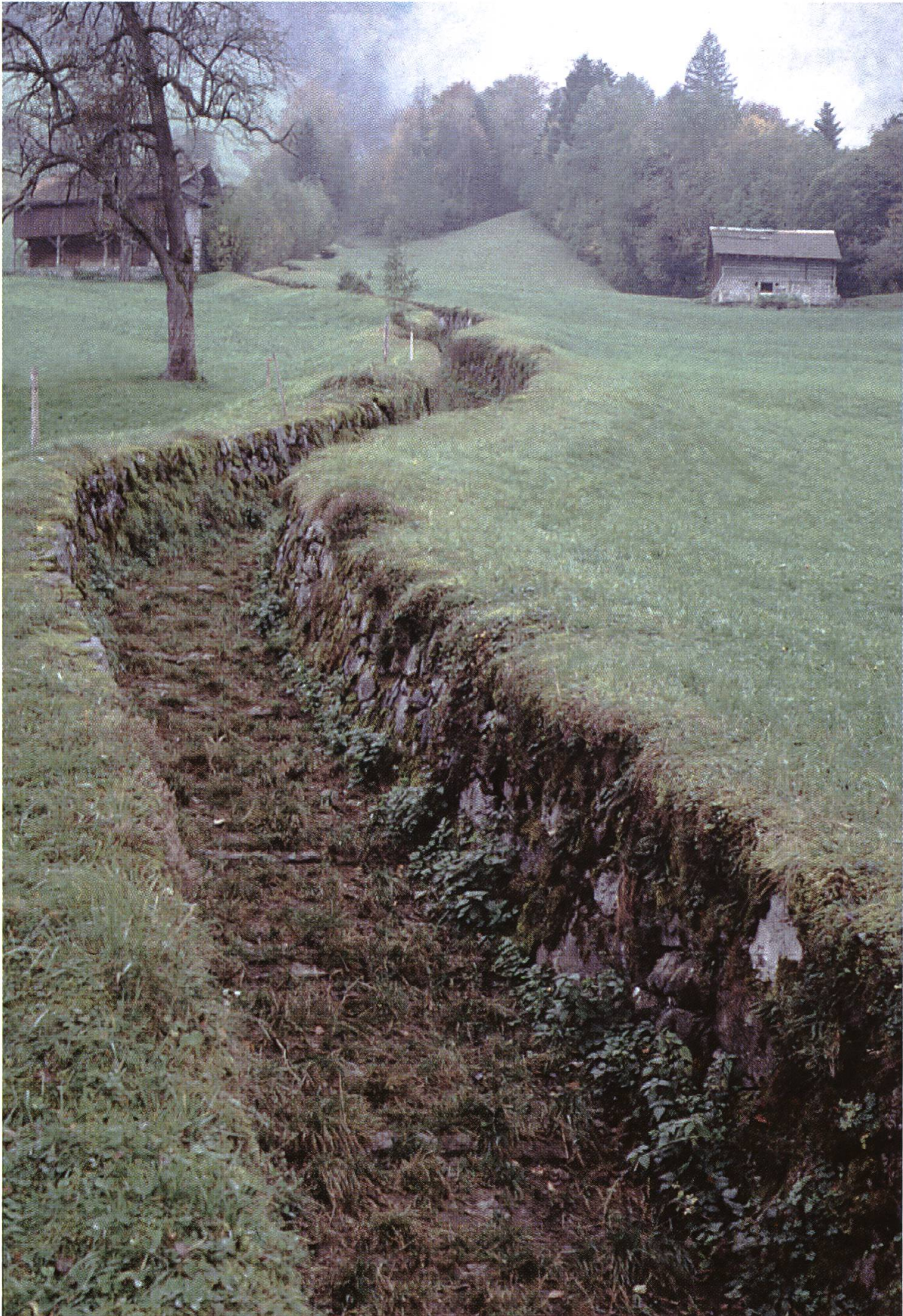
Abb. 1.: Alte Alpgasse bei Attinghausen – eine eindruckliche Schnittstelle zwischen Landwirtschaft und Landschaftsschutz.