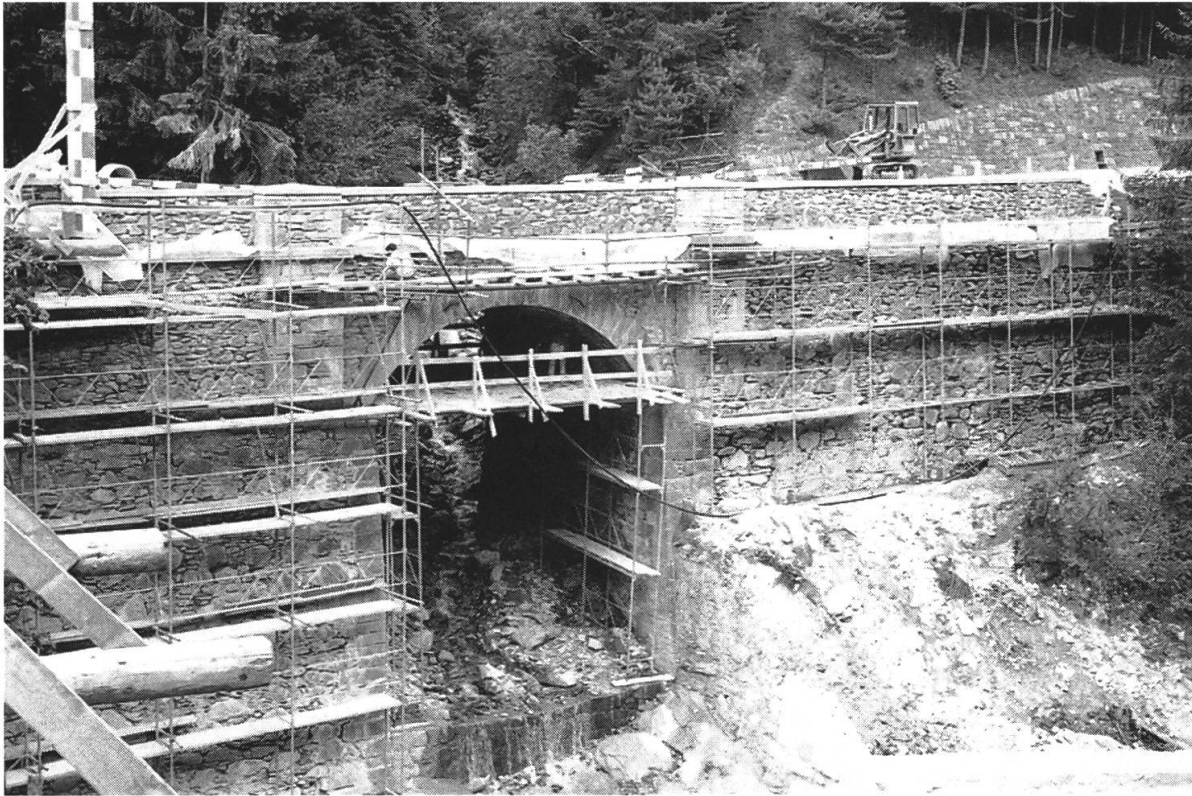
Abb. 5: Ein aufwendiger Beitrag an den Landschaftsschutz durch die Bauwirtschaft – Die Sanierung der Raniabrücke in der Viamala.