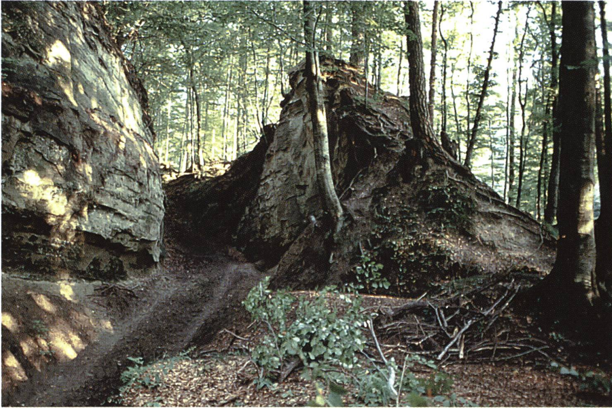
Abb. 6: Die Leuenhole bei Burgdorf, Teilstück der spätmittelalterlichen Hauptverbindung von Bern nach Luzern. Sie wurde als landschaftliches Markenzeichen und Teil der Emmentaler Geschichte u.a. auch in Gotthelfverfilmungen einbezogen.

Kulturlandschaft erleben, er wird auch einen Teil seiner eigenen Geschichte begehen, nämlich den Weg, den die Emmentaler Bauern 1653 bei ihrem Aufstand gegen die Berner Obrigkeit benutzten. Diese – die «eigene» – Geschichte und Kultur ist als Markenzeichen in jeder Hinsicht unverwechselbar. Sie ist ebenso ortsgebunden wie die Geschichte der alten Bern–Luzern–Strasse, mit ihren unzähligen Erzählungen und Legenden.