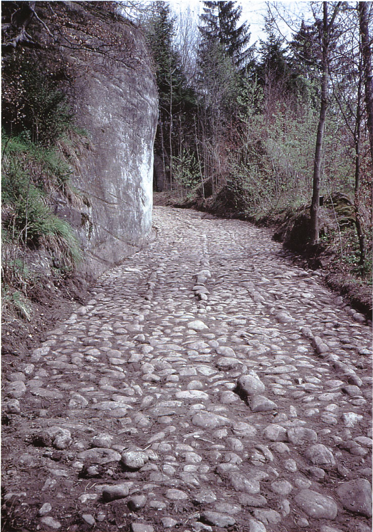
Abb. 4: Teilstrecke des Projektes «Jakobswege durch die Schweiz» in der Nähe von Schwarzenburg – attraktiver Beitrag zum neuen Tourismuskonzept des Bundes.