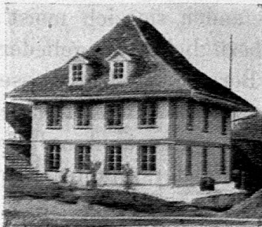
Altes Schulhaus in Messen, erbaut 1825.

nur noch 25 alte; in diesen 82 Schulhäusern gebe es 91 fast durchgehends grosse Schulstuben, 70 Lehrerwohnungen und 39 Scheuerungen. „An Stelle manchen Schulkerkers“, sagt der Bericht wörtlich, „ist nun eine Schulstube getreten, in welcher das Kind doch wenigstens des Sonnenlichtes nicht mehr ermangelt, sowie der gesunden Luft, welche es ehemals nur ausser seiner Schule finden und einatmen konnte.“ Aus der dem Rapporte beige-