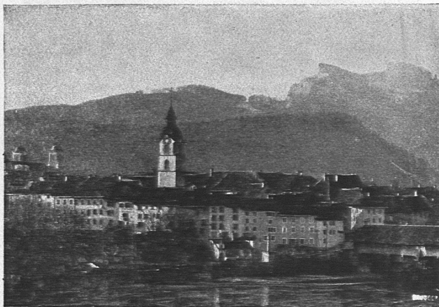
Ansicht von Olten

Nach Ankunft: Bezug der Teilnehmer- und Logiskarten im Bureau des Ortsausschusses: Kiosk am Ausgang des Bahnhofes, bei der Aarebrücke.