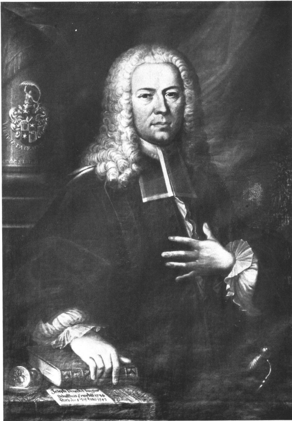
Schultheiss Joseph Benedikt Tugginer 1681 — 1743