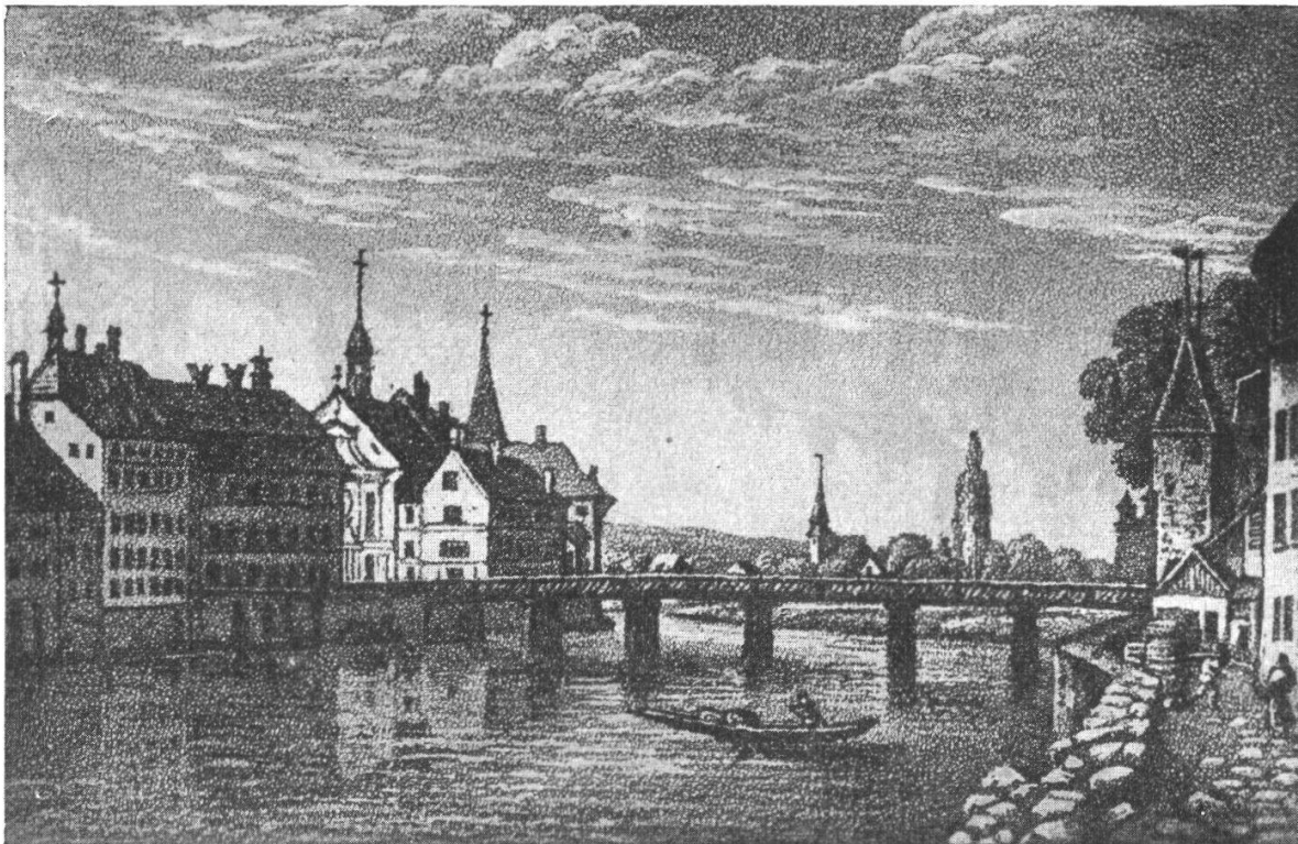
Arbeitshaus, Waisenhaus und Spital.

der Bau des Arbeitshauses statt, der einen Aufwand von 11 825 Pfd. erforderte. Während vorher die verschiedenen Aufgaben dem Spital überwiesen worden waren und die Bettelstube, des Brudermeisters Wohnung und das «hindere Gebäuw» miteinander in Verbindung standen, bedeutete die Errichtung der Prison und der Bau des Arbeitshauses für den Spital eine Entlastung von allerlei Volk, das besser anderweitig untergebracht wurde, und der Spital begann sich allmählich in dieser Periode als Krankenhaus zu spezialisieren. 40