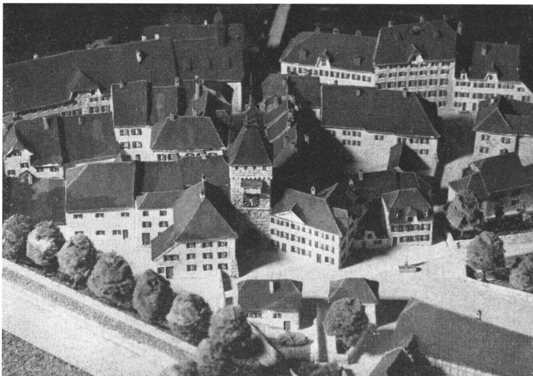
Das Berntor mit westlichem Anbau als Erweiterung des Schellenwerks rechts Mitte die Prison, rechts oben das Arbeitshaus

Bereits am 9. Juni 1762 reichten die Inspektoren des Spitals und Waisenhauses dem Rate auf den von ihm am 26. Mai hin erhaltenen Auftrag den Entwurf zu einer Ordnung für das neue Schellenwerk ein, der im Einzelnen wie folgt lautete: