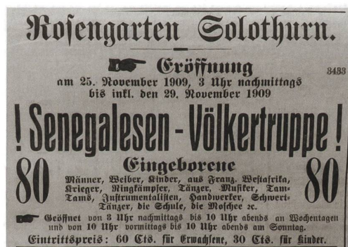
Abb. 1: Inserat im Solothurner Tagblatt 25.11.1909.

Dabei stütze ich mich in erster Linie auf Berichte in drei Solothurner Lokalzeitungen 2 . Amtliche oder private Dokumente dazu fanden sich keine. Und: Erst recht fehlen Quellen, welche die Perspektive der Mitglieder der sene-