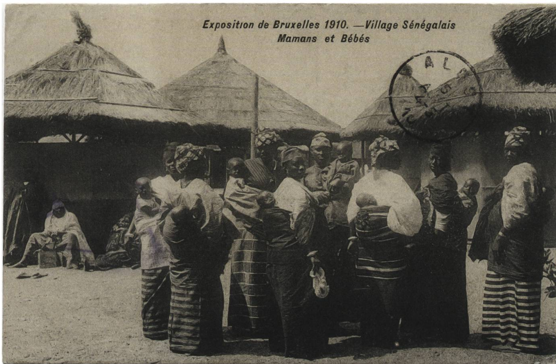
Abb. 17: Die Mütter tragen ihre Kleinkinder in traditionellen Tragtüchern auf dem Rücken. Babys waren als Publikumsmagnet ein fester Bestandteil des Programms der «villages sénégalais»; Im Hintergrund sind Bauten des Dorfes zu sehen. Brüssel, Weltausstellung 1910, zeitgenössische Postkarte (Phototypie), Préaux Frères, Ghlin-lez-Mons.

«Das erste war die Abendandacht der Männer nach mohamedanischem Ritus, wohl über 20 an der Zahl. Wie auch unter den Frauen und Töchtern sieht man darunter einige Prachtsfiguren die da mit ausgebreiteten Armen den Boden küssten und laut beteten.» 70