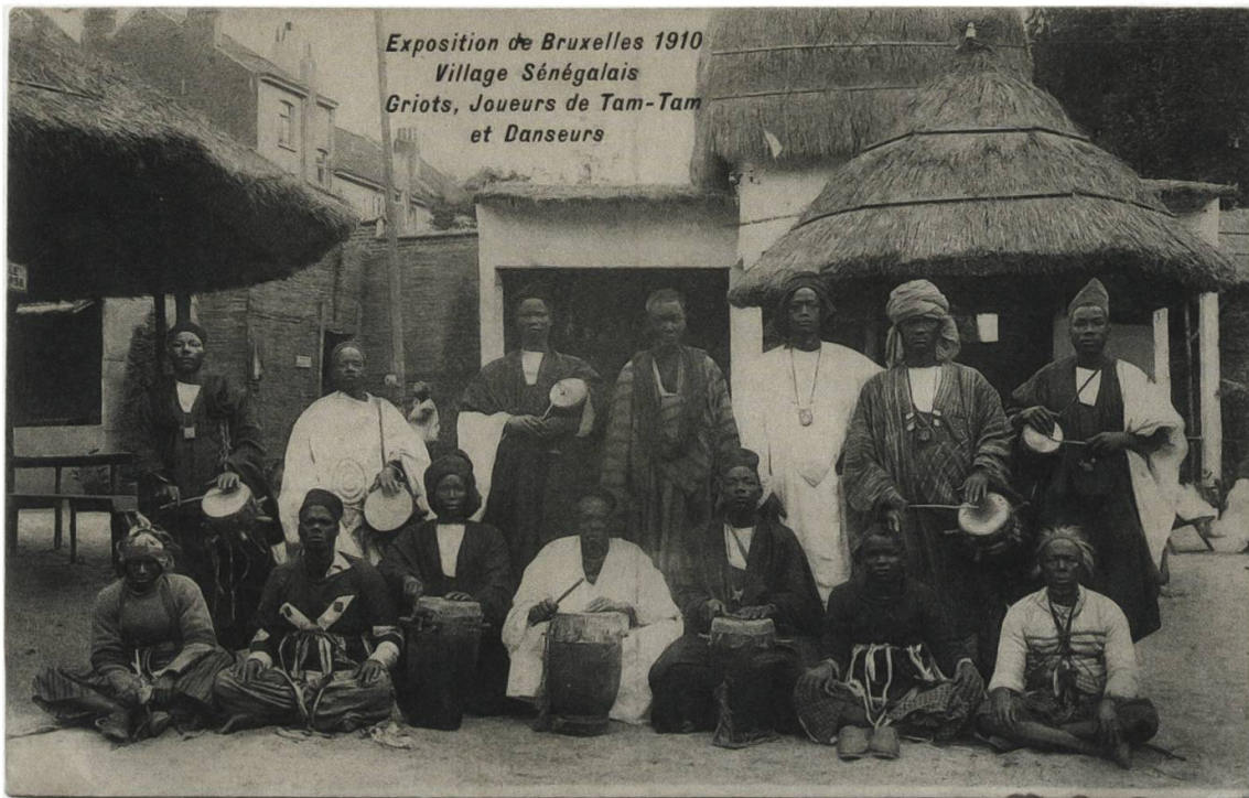
Abb. 16: Die Griots, Trommler und Tänzer der Rosengarten-Truppe an der Weltausstellung in Brüssel, 1910. Die «sabar»-Trommeln der Wolof und Serer werden mit einem Stock geschlagen, zeitgenössische Postkarte (Phototypie), Préaux Frères, Ghlin-lez-Mons.

Nicht fehlen durfte im village sénégalais die muslimische Glaubenspraxis mit Andachten während der Gebetszeiten sowie Koranschule und Koranstudium. Die Solothurner Zeitung schreibt: «Ein Trupp drolliger kohlschwarzer Knirpse hockt vor ihrem Lehrer auf einem Tisch und hört mit mehr oder weniger regem Interesse seinem monotonen, singenden <Lehrverfahren> zu.» Und weiter: «Neben ihm liest sein Kamerad mit eintöniger, halb singender Stimme die Verse des Korans herunter.» 68