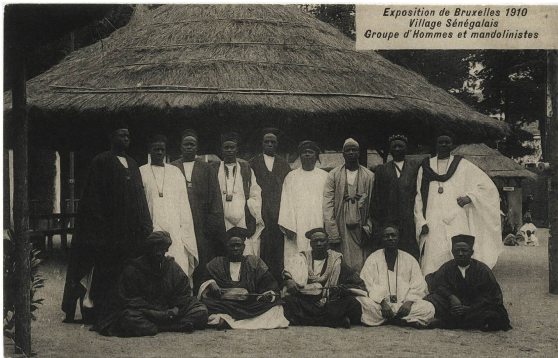
Abb. 13: Ein Teil der Rosengarten-Truppe an der Weltausstellung in Brüssel 1910. Vorne sitzen zwei Griots. Beide spielen die «xalam». Zeitgenössische Postkarte (Phototypie), Préaux Frères, Ghlin-lez-Mons (Privatarchiv V. Fröhlicher).