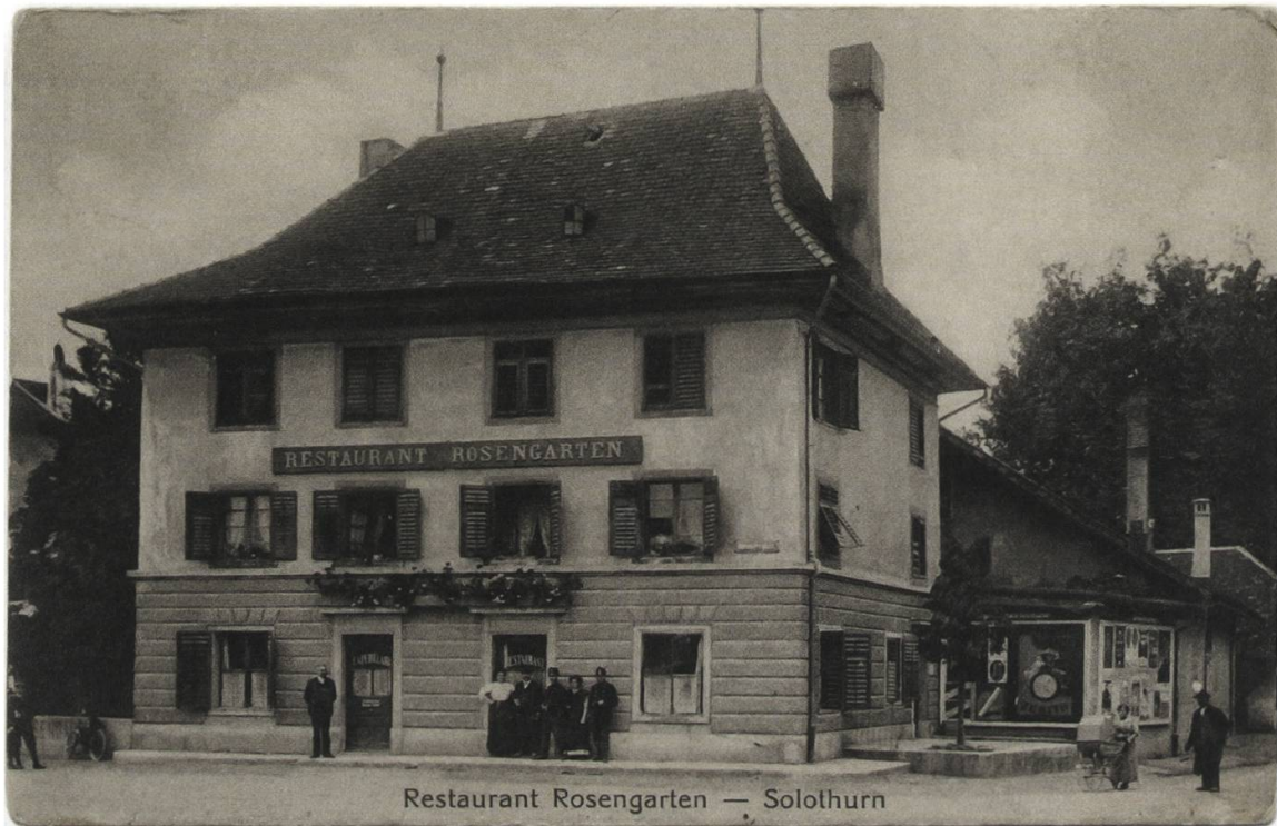
Abb. 4: Das Restaurant Rosengarten um 1910, zeitgenössische Postkarte.

haltungsprogramm sollte Gäste anlocken und damit den Umsatz steigern. Mit der zunehmenden Beliebtheit des Kinematographentheaters , das heisst des Kinos, erhielten Darbietungen, wie die hier untersuchte, ernstzunehmende Konkurrenz. Noch vermochten sich Völkerschauen vor dem Ersten Weltkrieg allerdings weiterhin gegenüber dem Kino zu behaupten, «bewegte Bilder» von fremden Welten hatten sie ja ebenfalls zu bieten – und zwar live und in Farbe. 11 Bemerkenswert ist, dass am 27. und 28. November 1898 im Rosengarten die erste Kino-Aufführung in Solothurn stattfand. 12