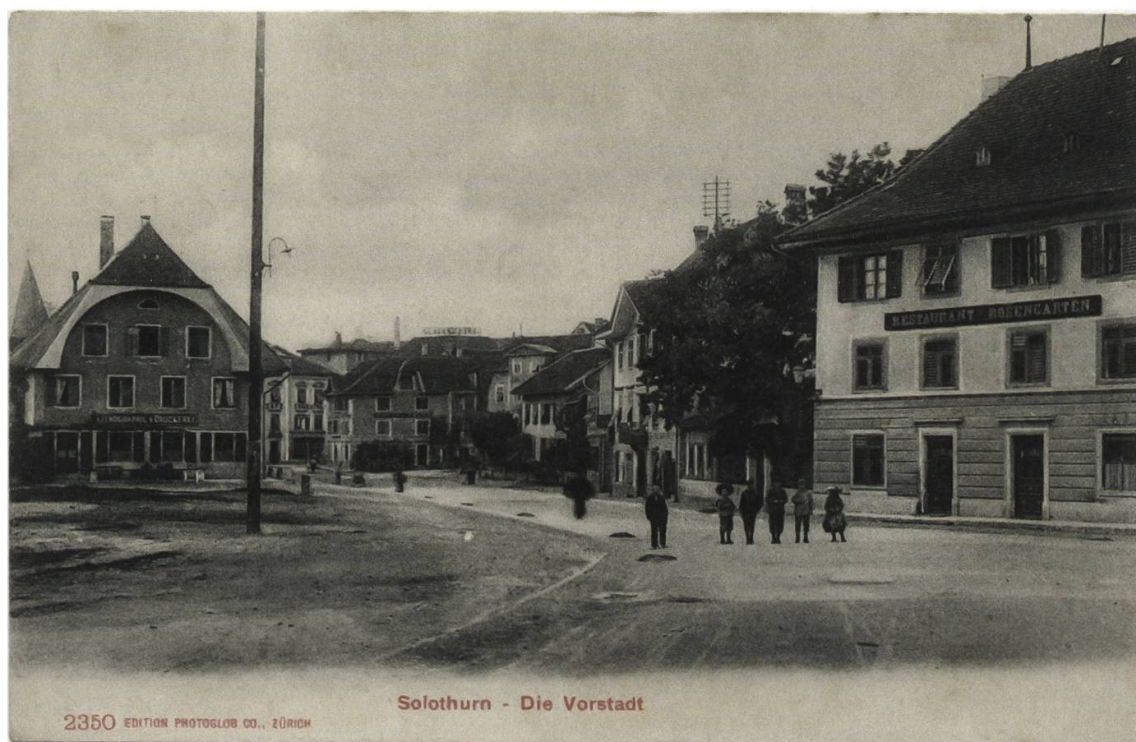
Abb. 3: Dornacher- und Rossmarktplatz um 1910, zeitgenössische Postkarte (Privatarchiv V. Fröhlicher).

Die Lokalitäten eigneten sich für grosse Anlässe «für Schulen und Gesellschaften» (so vermerkt auf einer Postkarte), insbesondere auch für kulturelle und Unterhaltungsanlässe, aber auch für Velofahrer als Touren-Raststätte. Die Nähe zum Bahnhof «Neu-Solothurn» war ein zusätzlicher Standortvorteil. Bereits 1903 (10.–13. August) gastierte eine Völkertruppe im Rosengarten, nämlich eine «Togomandingo-Truppe» («30 Personen. Afrikanisches Dorf – Küche – Lagerleben, Leben und Treiben im Freien. Wissenschaftlich hochinteressant.»). 10