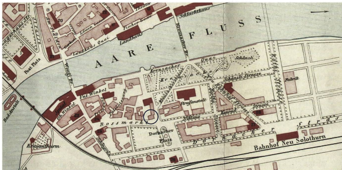
Abb. 2: Vorstadt Solothurn um 1908; Der Rosengarten ist blau eingekreist. Ausschnitt des Stadtplanes im Adressbuch der Stadt Solothurn 1907/1908 (Foto Zentralbibliothek Solothurn).

zeptablen humorigen Spruch, dem er durch seine Erwähnung zusätzliche Publizität verschaffte. Die Fahrt der afrikanischen Gruppe auf zwei (offenbar fünfspännig von Pferden gezogenen) Gesellschaftswagen der Fuhrhalterei Wyss 7 vom Bahnhof «Neu-Solothurn» auf der verschneiten Dornacher- oder Niklaus-Konrad Strasse zum nahen Restaurant Rosengarten in der beschaulichen Solothurner Vorstadt lässt in unserer Fantasie das Bild einer eintreffenden Wandertheater-Gruppe wach werden. Ein eigentlicher Werbeumzug war die Fahrt ins Restaurant Rosengarten kaum – die Jahreszeit und die gewählte Route liessen dies nicht zu.