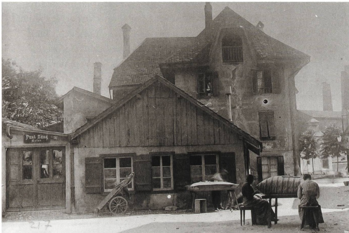
Abb. 7: Näherinnen auf dem Kreuzacker in der Vorstadt, Fotografie um 1910 (Zentralbibliothek Solothurn, Fotosammlung).

Räumlichkeiten allerlei Menschenkinder ausgestellt gehabt: Riesinnen und Zwerge, Hungerkünstlerinnen, tätowierte Damen, Spinnen mit Menschenköpfen und verschiedene andere, aber eine so bunte Gesellschaft wie diesmal hat er noch nie in seinen Lokalitäten gehabt.» 17