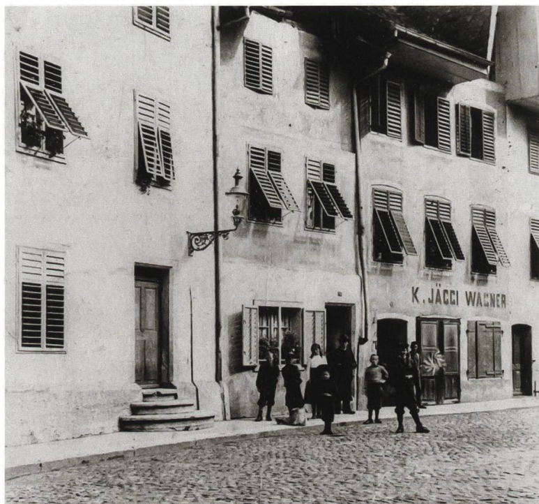
Abb. 5: Unterer Winkel in der Solothurner Vorstadt, 1910, Fotografie.

mit dem bäuerlich-ländlichen Milieu des näheren und fernerer Umlandes verbunden. Die Vorstadt war auch Solothurns «kleines Judenviertel». 14 Jüdische Vieh- und Pferdehändler nahmen einen wichtigen Platz im gewerblichen Leben dieses Stadtteils ein.