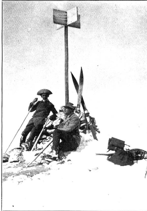
Toutain, phot. Dr. Stäubli (links) auf dem Gipfel des Aroser Rothorns (März 1893).