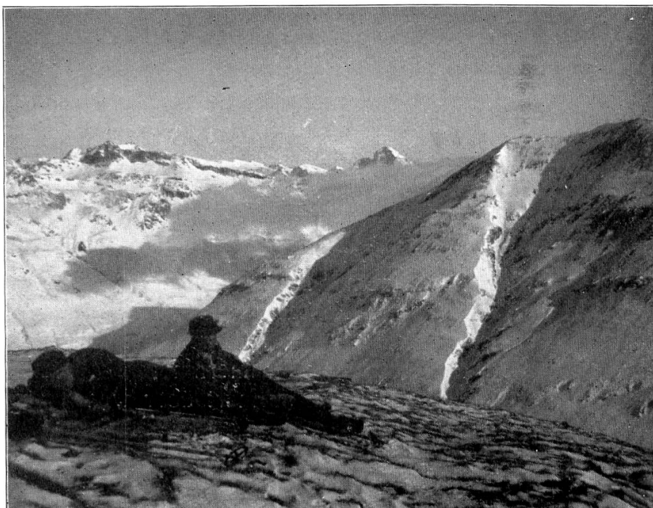
Rast auf dem Hohenbühl

Die Post fährt im Winter nur einmal im Tage von der Bahnstation Thusis der Albulabahn herauf. Doch befördert sie von Andeer an nicht mehr als eine Person, so dass