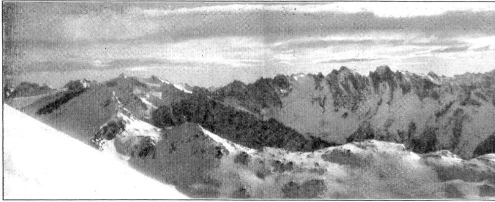
Die Bergellerberge vom Gletscherhorn aus