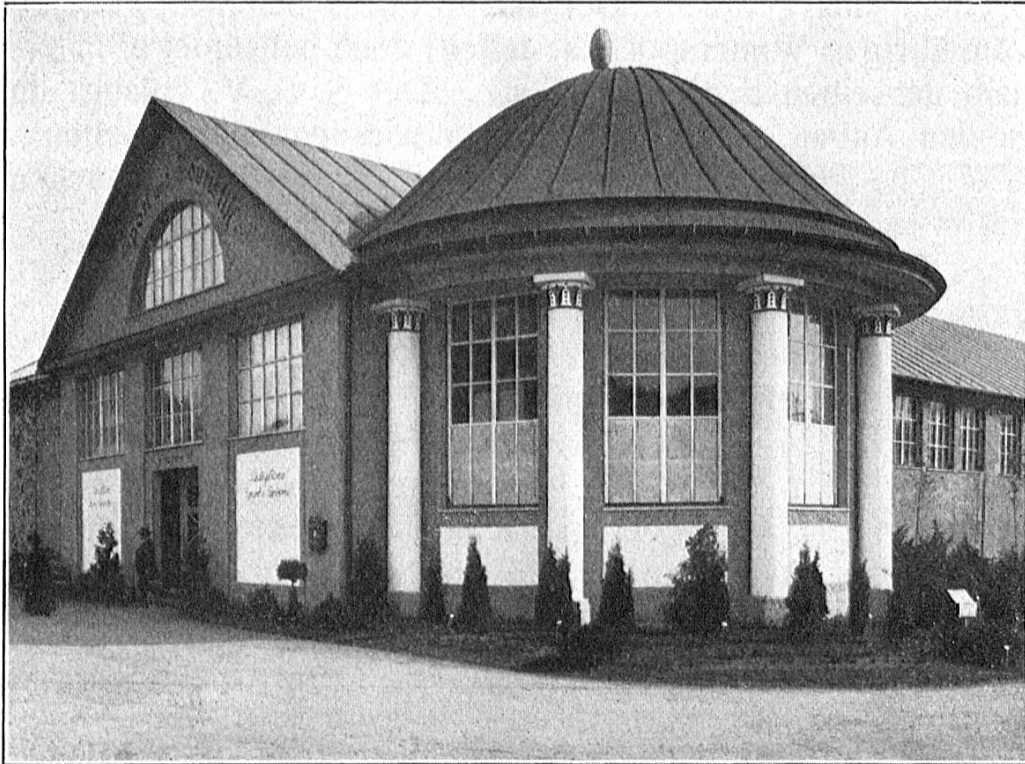
Pavillon des S. S. V. an der Landesausstellung