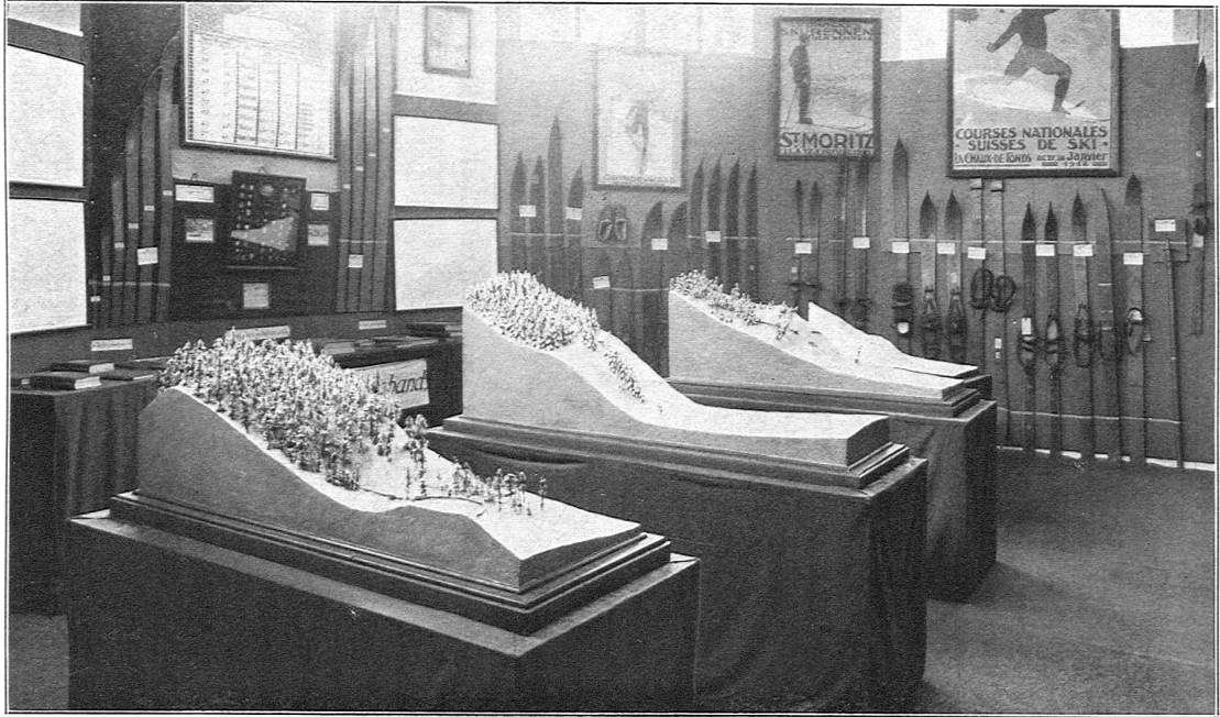
Ausstellung des S. S. V. (im Vordergrund Sprunghügel von St. Moritz, Klosters, Davos und Engelberg)